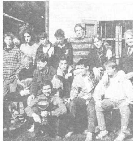
Uspešni odbojkarji s pokalom

V nedeļjo dopoldne so nam gostitelji pripravili še izlet v gozdni park Caregga, tako smo se polni lepih vtisov vraāili