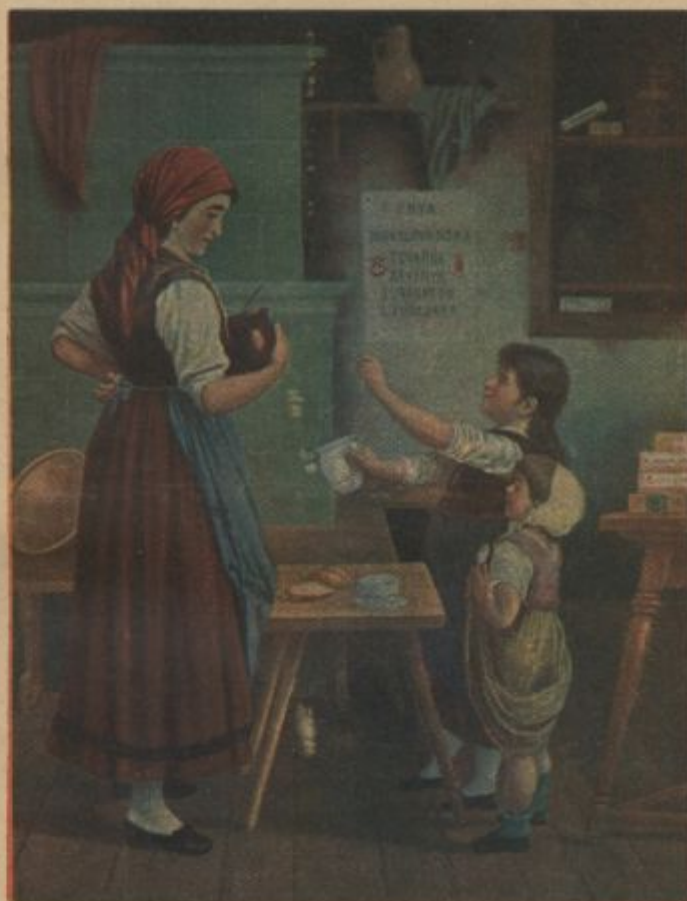
Mama, še . . . !

Sicer je res, da je naš narod maloštevilen, naša zgodovina majhna, uborna in malo znana. Junake in junakinje, ki bi nas navduševali, imamo kvečjemu — v pravljičah in pripovedkah, saj smo bili vedno le pri-