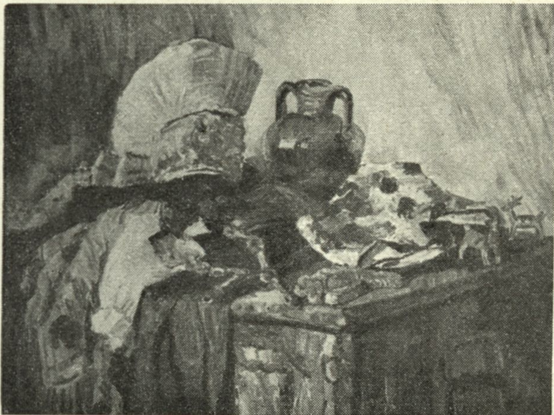
ANICA ZUPANEČ - SODNIK: Tihožitje narodne noše 2