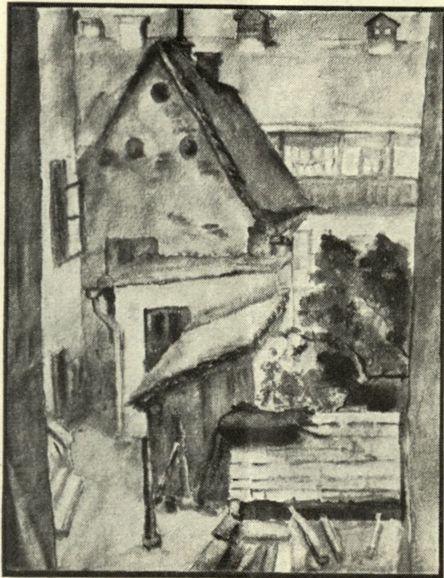
TEREZIJA ŠANDOR: Dvorišče