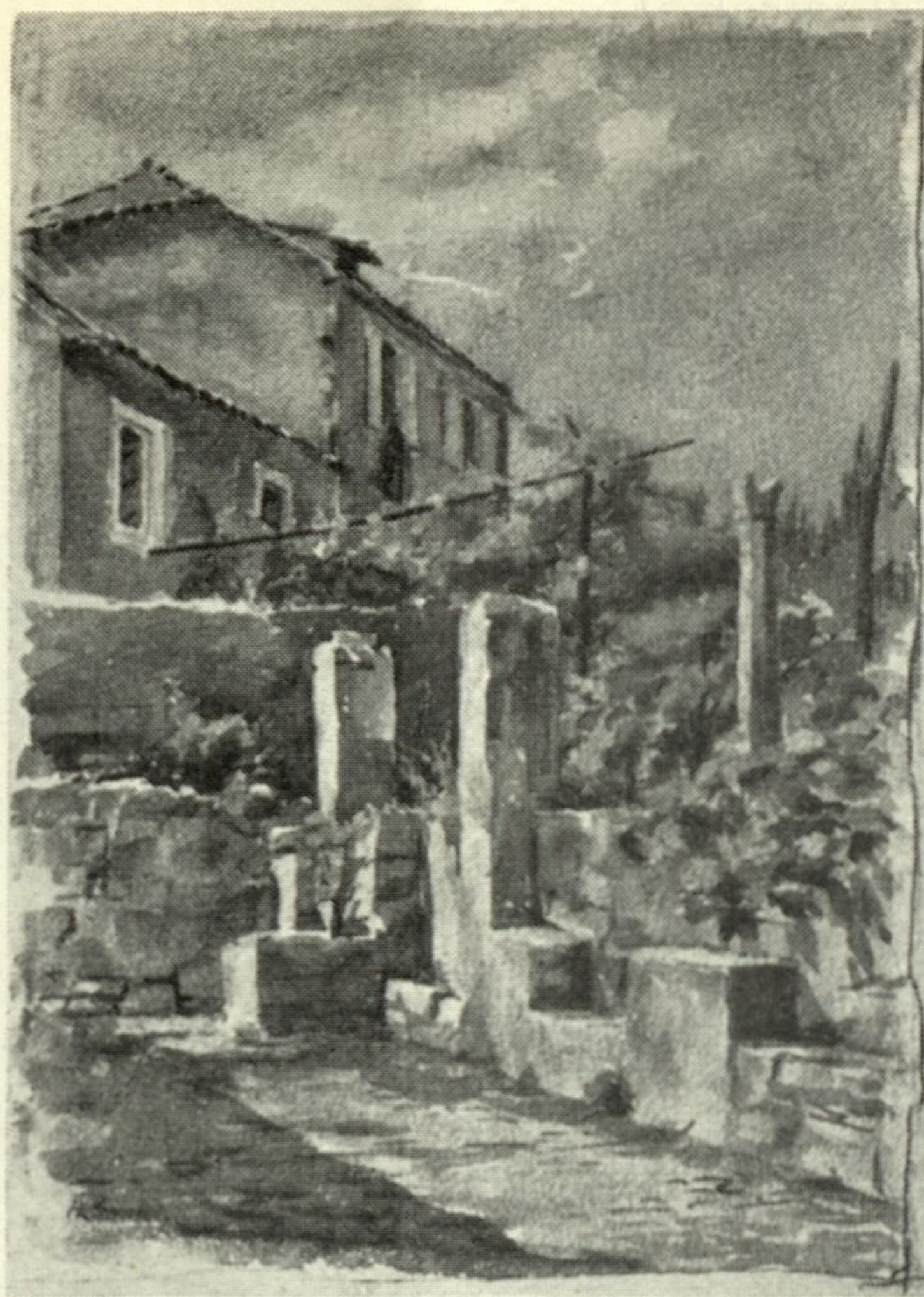
AVGUSTA ŠANTEL: Motiv iz Koločepa