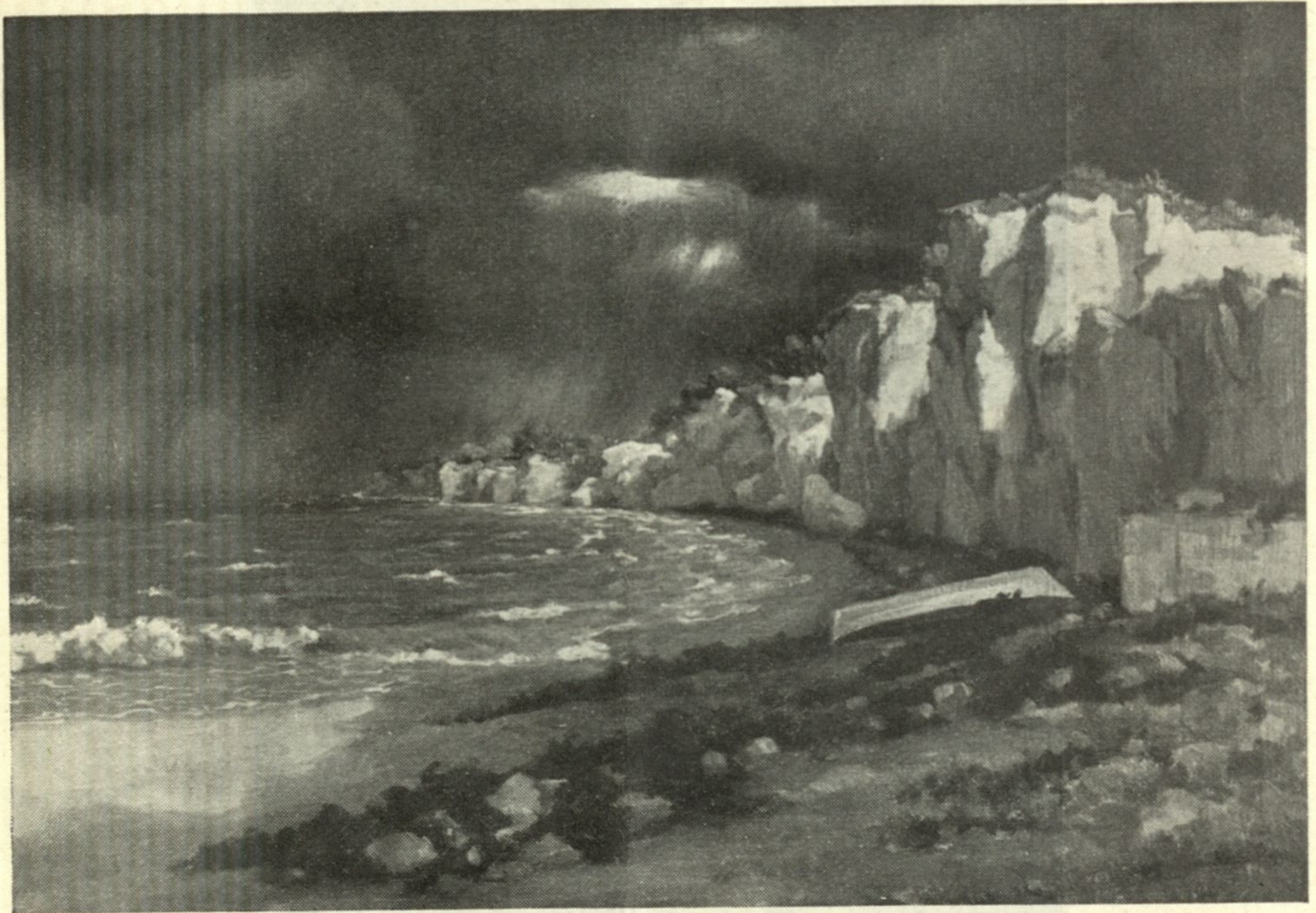
NASTA ROJC: Naše morje