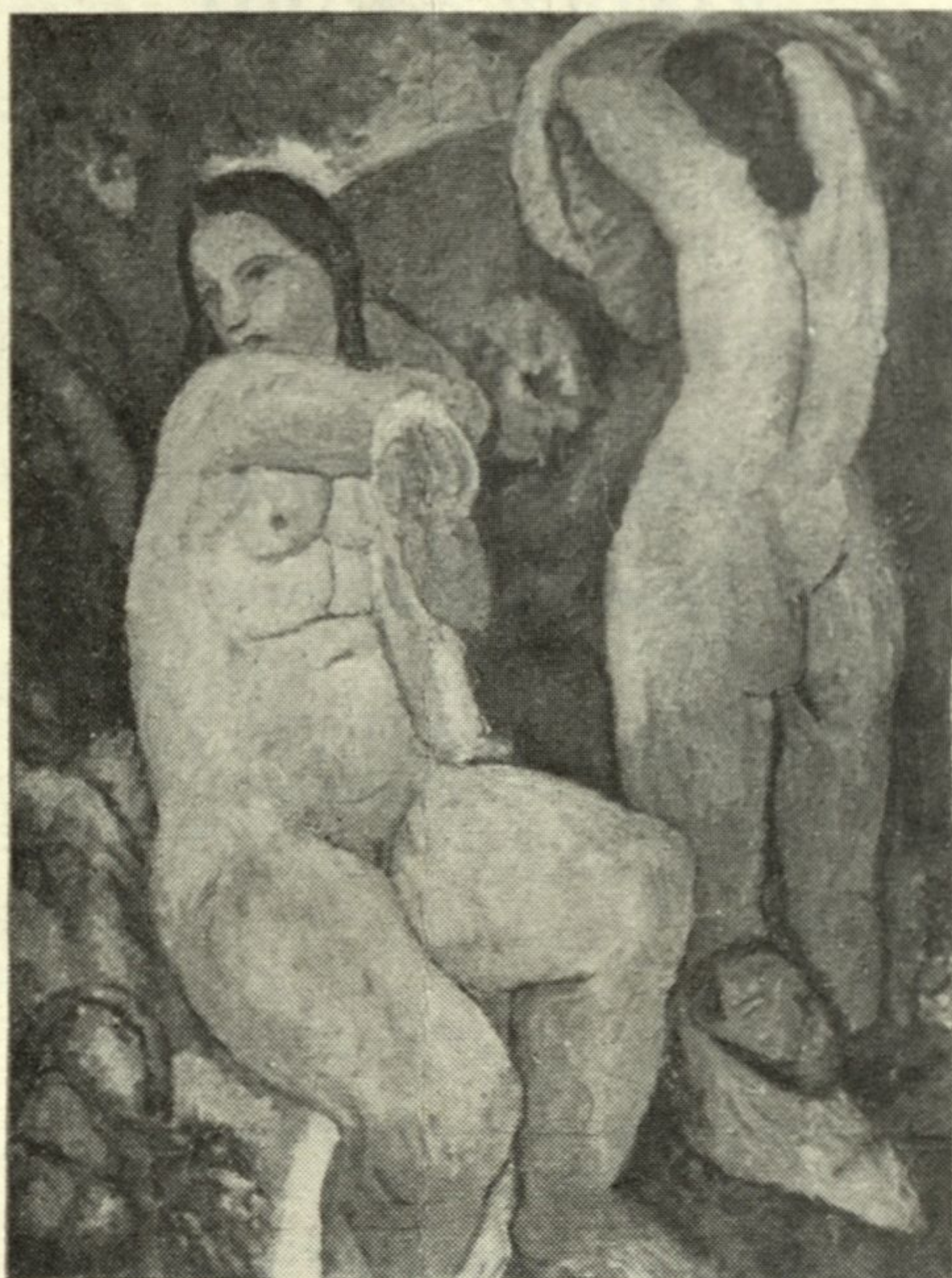
RENÉE GORJUP - DUFOUR: Po kopeli