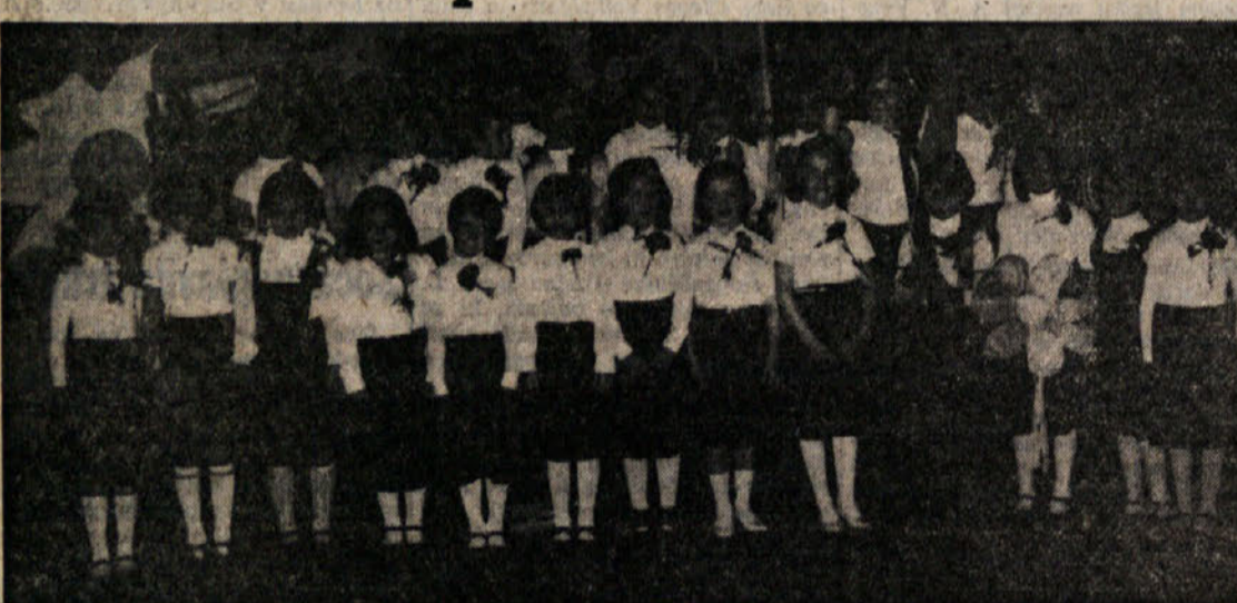
Na proseški osnovni šoli so v soboto imeli zaključno šolsko prireditev. Na slikli otroci dveh prvih razredov, ki so nastopili na prireditvi.