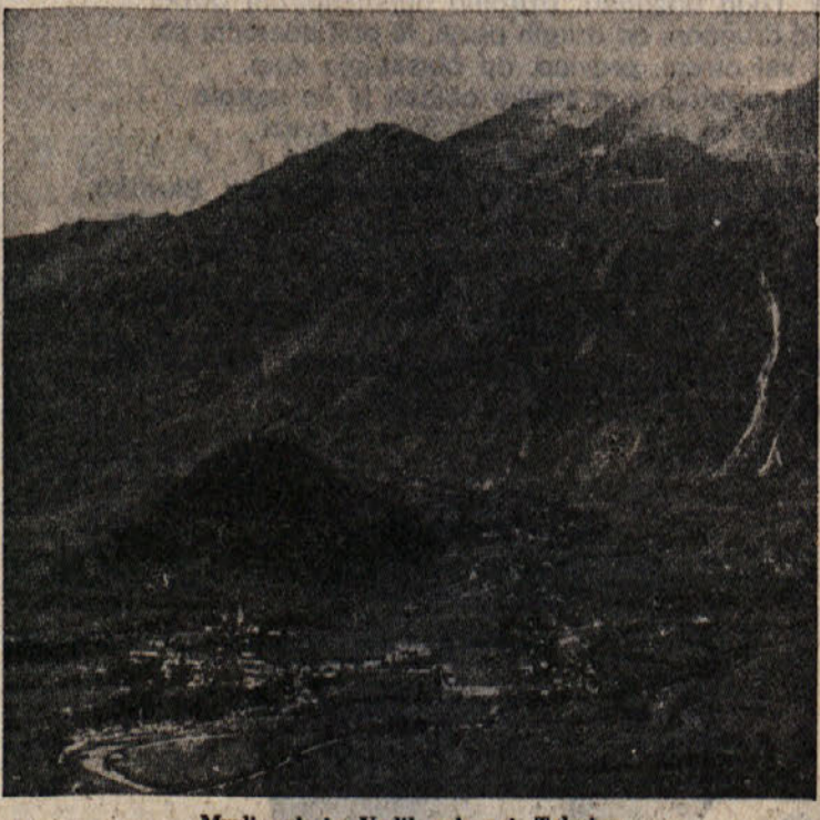
Mrzli vrh in Vodil vrh pri Tolminu

V ZGORNJEM POSOČJU Italijanska pehota je napadla 21. oktobra ob 10. uri zjutraj, in to od Krna do morja. Napad je imel tri glavna težišča: tolminsko mostišče, goriško mostišče in Doberdobska planota. Prvi napad je bil na sektorju Krn - Sv. Lucija. Manjši taktični uspeh so napadalci imeli v ostrem in vztrajnem napadu od hriba Sleme do Tolmina,