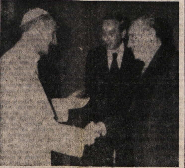
Z obiskom tajnika madžarske partije Kadarja pri papežu Pavlu VI. je dosegel svoj vrhunec dolgoletni proces zbliznevanja med Madžarsko in Vatikanom. Kadarjev obisk je obenem prvi obisk nekoga vzhodnega komunističnega tajnika pri papežu, kar tudi dokazuje, da so se odnosi med Sveto stolico in socialističnimi državami v zadnjem času bistveno spremenili. Na sgrorni sliki: Pavel VI. pozdravlja madžarske goste ob prihodu v Vatikan