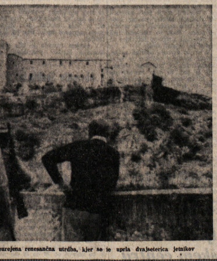
Kaznilnica v Spoletu, za silo preurejena renesančna utruba, kjer so je uprta dvajseterica jetnikov