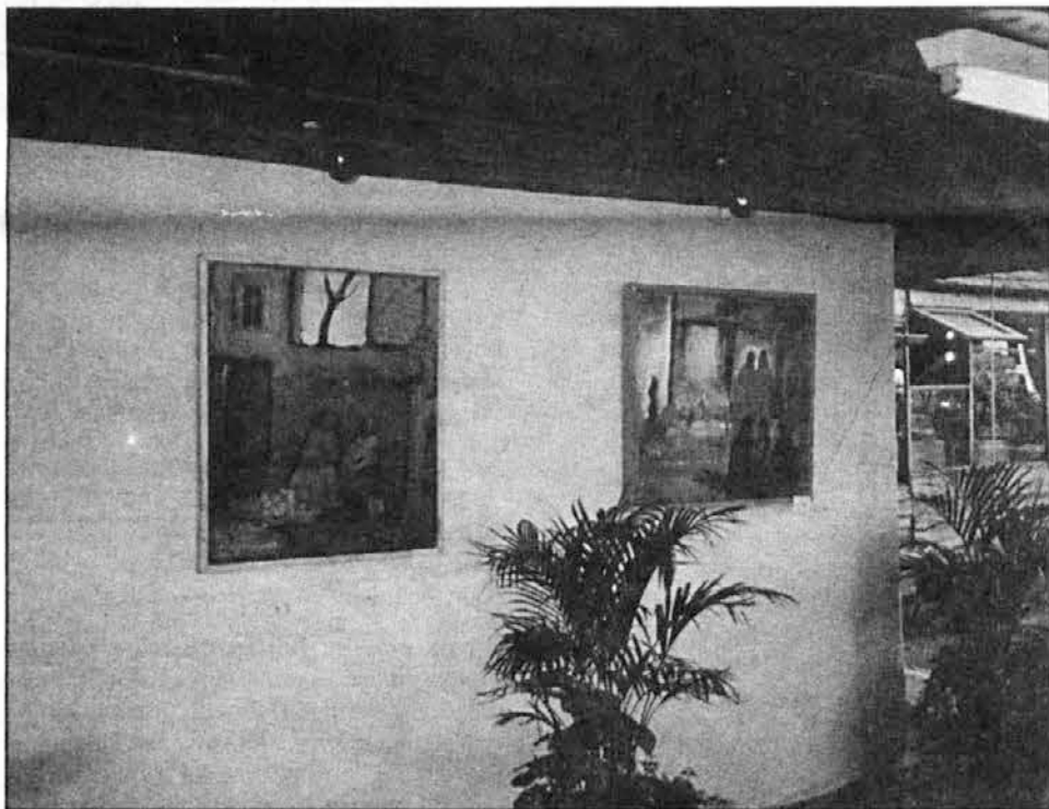
Slike akad. slikarja Milana Volovška na razstavi SPD-SKA