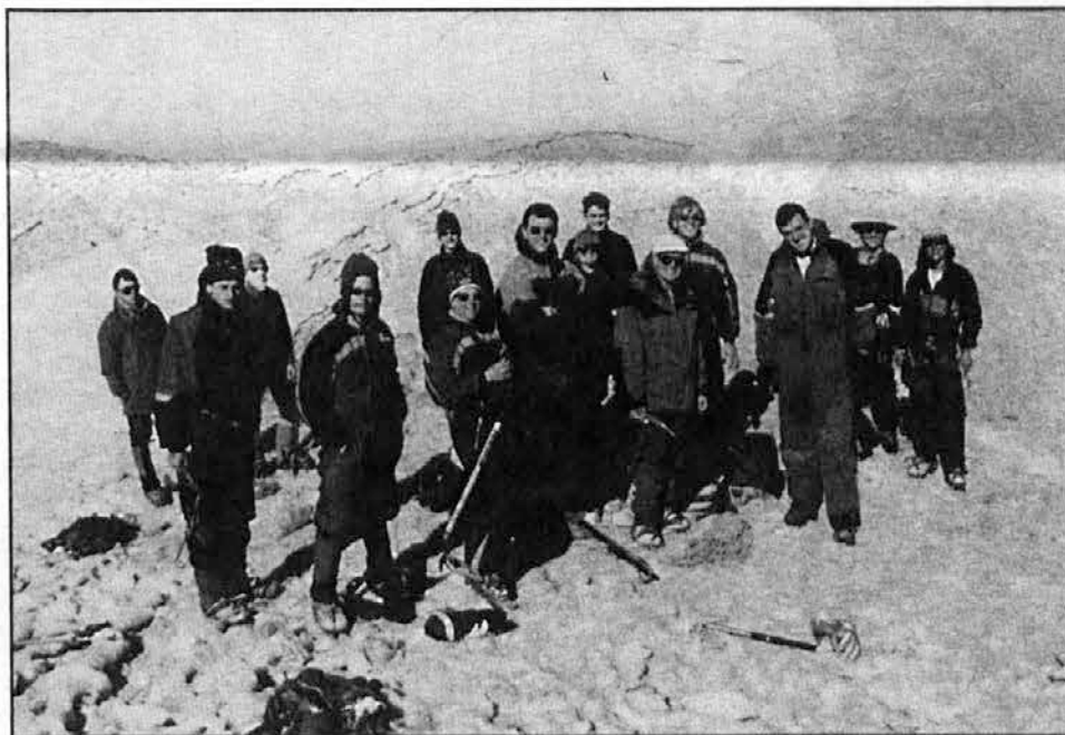
Depresión na Tronadorju

Tinka, tonka... bom vsako soboto zvonil in pozvanjal k delu in počitku. Vsem pa želim, naj „semena vzkalijo in rodijo kakor klasje zrna zlata, da bo ob letu in tinka tonka, vaša žetev bogata.“