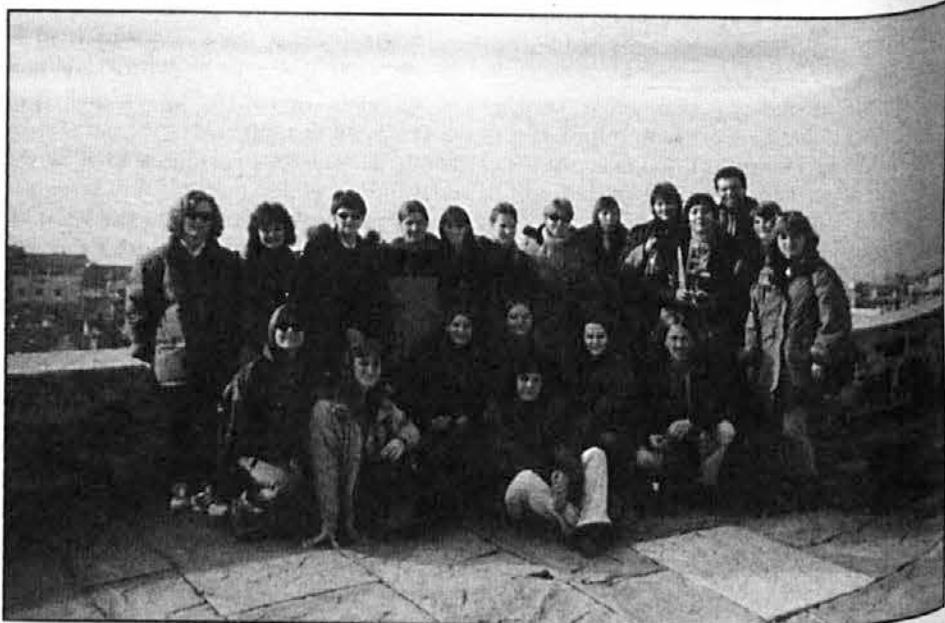
Skupina na slovenski obali

Po večerji smo večkrat raziskovali in odkrivali vsemogoče zanimivosti o kraju, kjer smo stanovali. Sneg nas je spremljal že od prvih dni, zato si lahko predstavljate naše navdušenje ob zasneženi naravi. Ke-