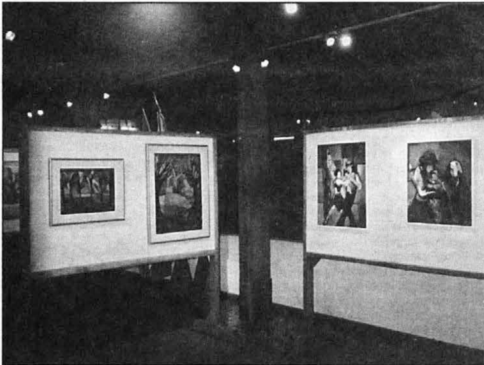
Pogled na razstavní prostor v Bariločah