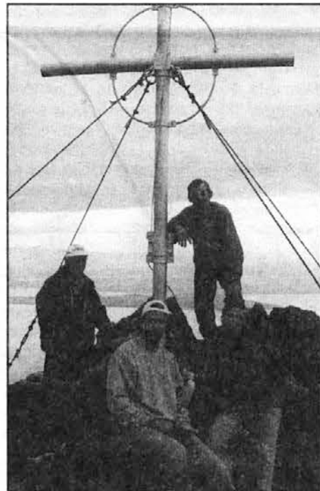
Križ na vrhu Capille. Prvi je bil postavljen leta 1952, drugega (na sliki) so postavili Slovenci deset let pozneje.