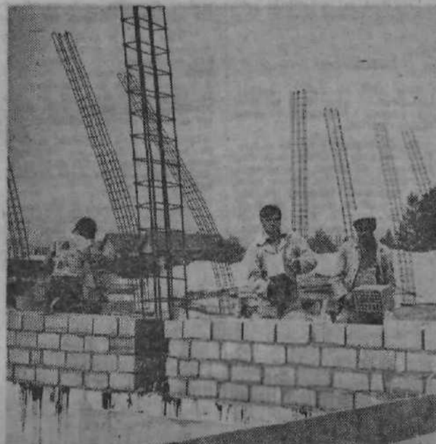
S sredstvi iz drugega samopriskevka bo zrasel ob Dečkovi ulici vzgojni zavod Janeza Levca. Gradi ga SGP Graditelj iz Kamnika. Objekt bo dograjen maja prihodnjega leta.

Dolga je torej pot, da predlog, ki sploh ni slab, pride do pristojnih. Če bo Ljubljanski urbanistični zavod ravnal prav tako spoštljivo, bomo čez nekaj let lahko ob Gramozni jami zagledali nov. Ljubljani, predvsem pa občini, prepotraben park. Ker vsi dobro vemo, koliko let je potrebnih, da zrastejo drevesa, lahko z gotovostjo trdimo, da je čas, ko bo nov spominski park povsem nared, še zelo daleč.