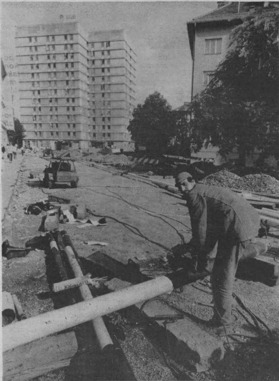
Krejanje Tabora se že veseljijo, ko bodo končana dela na Vidovdanski ulici nasproti Doma tehniških šol, saj bodo dobili novo zelenico, ki jih je v ožjem središču mesta seveda veliko premalo. Ta prenovitev in ozelenitev bo Vidovdanska praktično spojila s parkom na Taboru in ne bo več namenjena parkiranju; tu bo zelenica z ozkimi pešpotmi. Zasadili bodo deset novih dreves in 1750 grmov. Prostor bodo osvetlili s 56 novimi lučmi; pri platoju gostilne bo postavljen peakovnik, tik poleg pa večji rondo, obkrožen s klopmi. Pred DTŠ bo postavljena telefonska govornica, na novo pa bodo urejena tudi avtobusna postajališča na obeh straneh, tako da bodo umaknjena s cestišča in promet zaradi avtobusov ne bo več moten.