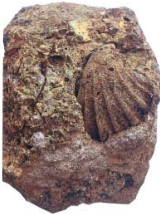
Sl. 2. Kameno jedro školjke Megacardita jouanneti (Basterot, 1825) v miocenskem kremenovem klastitu iz okolice Dobrine v Halozah; x 0,9.

Material: Kameno jedro v rjavorumenkastem kremenovem konglomeratu. Takšna