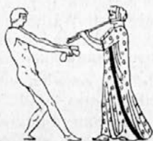
Pentatlet skače z ročkami. Poleg njega piskavec ali piskavka.