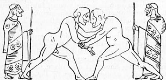
Rvaveca. Na straneh stojita atotleta s sodniško palico.

Vsi tekmovalci so stekli naenkrat. Iz mnogih namigavanj v starih poročilih posnemamo, da so pri steku takrat prav tako radi varali kakor dandanes. Žadosti glasno tudi priča določba, da tekmovalci ni smel namenoma teči počasneje, najsi bo, da je bil podkupljen, najsi bo iz kateregakoli drugega vzroka. Mesta na stečiču so izžrebali. Stekli so iz zmernega počepa in predklona; nogi sta bili uprti druga tik za drugo v žlebiče na stečiču, ki smo o njih govorili pri opisu tekališča.