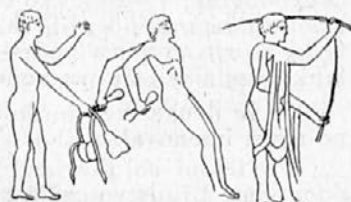
V sredi skakavec z ročkami pri doskoku.

Zmagovalci so bržkone tudi v olimpijah prvotno dobivali darila s trgovsko vrednostjo. Iz Homerja vemo, da je bilo to pri tekmah v navadi. V 7. olimpiadi so pa uvedli po nasvetu delfijskega preročišča preprost venec iz oljčnih vejic. Vejice je našel s svete oljke v altidi deček, ki so mu še živeli starši, z zlatim srpom. Vence so razstavili, da so jih hodili ljudje gledat.