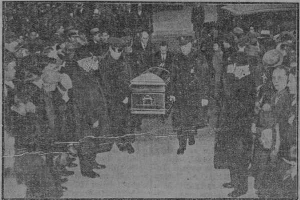
Zadnja pot bivšega predsednika Združenih držav Sev. Amerike Coolidgeja.