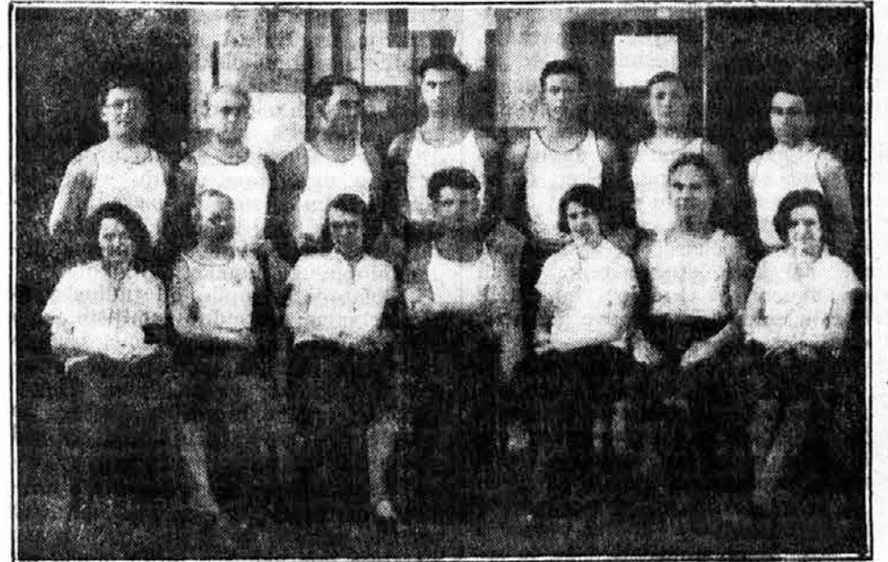
Prednjački zbor Sokolskog društva Varaždin

Približavajo se dani I sleta Sokolske župe Varaždin. Sama proslava za početje u suboto, dne 4 juna u 3 sata