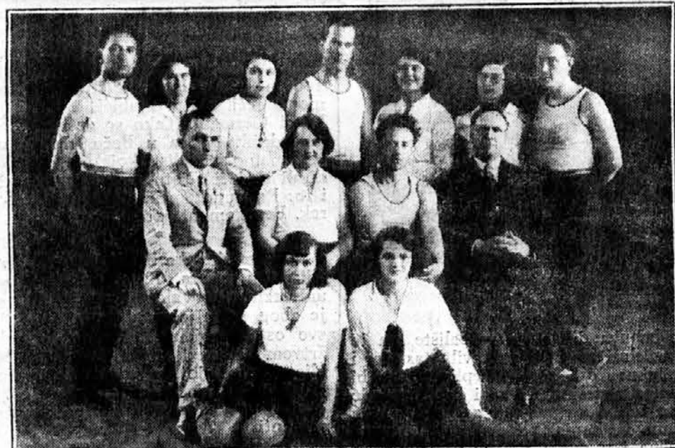
Učesnici prednjačkog tečaja za učitelje staropazovačkog sreza

COS i u Savezu Slovensko Sokolstvo, kad je uza sav taj naporan posao s najvećim veseljem i ljubavlju vršio to veliko kulturno delo.