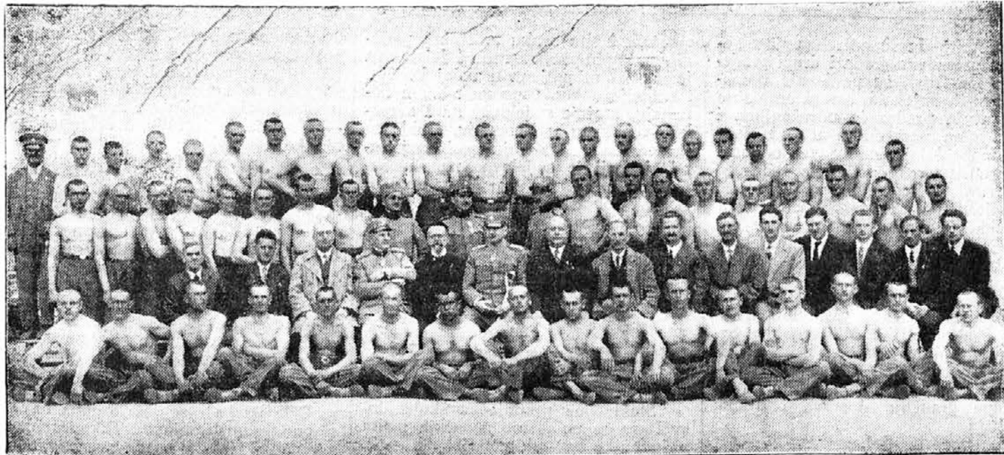
Naslavnici i učesnici I tečaja Sokolske škole za vojniko