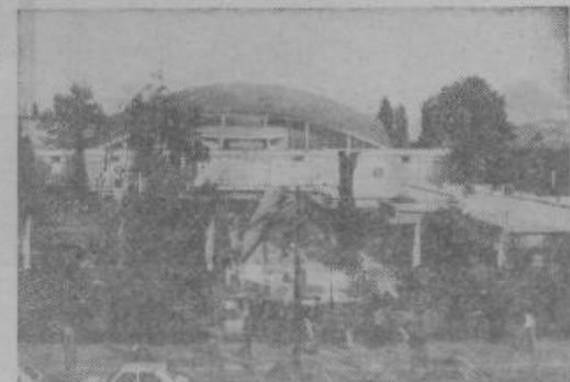
... in 1980. leta

Vojna in okupacija je prekinila tudi delovanje tega sejma. Neposredno po osvoboditvi leta 1945 ni bilo časa niti posebne potrebe po sejmih in razstavah. Šele marca 1954 je bila na pobudo slovenskega gospodarstva in trgovinske zbornice spet ustanovljena profesionalna organizacija, tokrat za prirejanje specializiranih sejmov in razstav pod imenom Gospodarsko razstavišče, ki tako sedaj slavi 25 let svojega obstoja. Tako je GR v letih 1955—1979 organiziralo že 216 specializiranih sejmov in razstav, od tega 103 mednarodne. Na teh sejmih je sodelovalo 42.000 razstavljalcev iz 56 držav vseh petih celin.