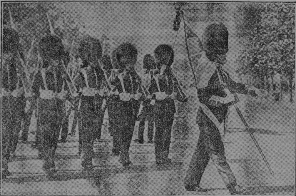
Angleška kraljeva garda.

Vlomilska družba pod ključem. Orožniki iz Kranja so predali v ljubljanske zapore 5člansko vlomilsko družbo, ki je vlamljala ter kradla po Kranju in