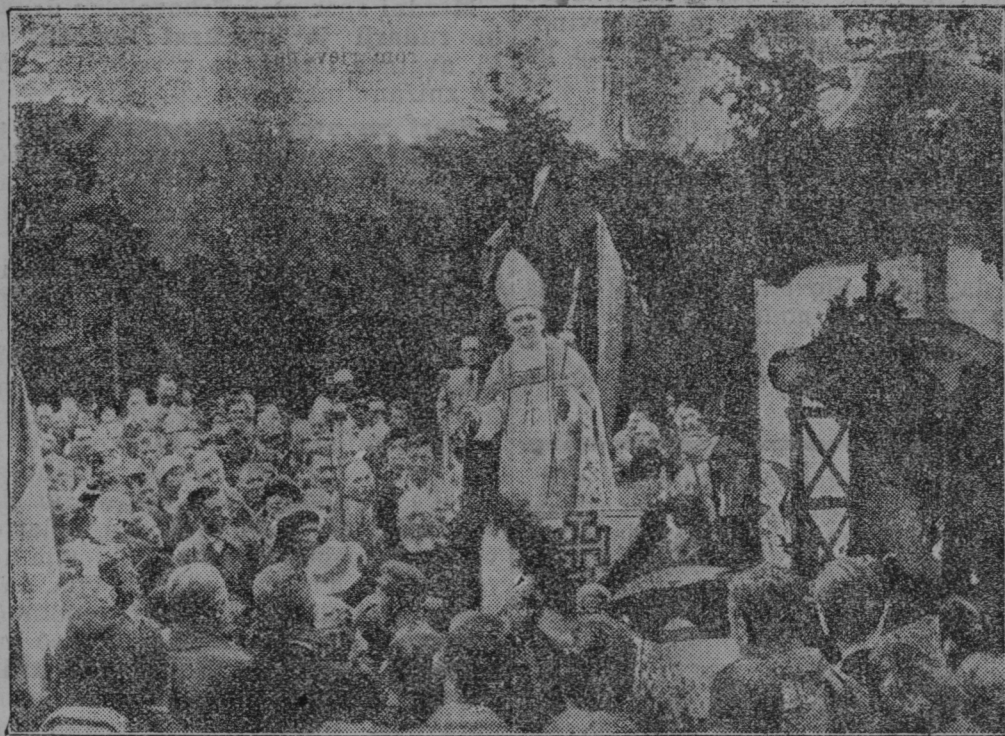
Dunajski kardinal dr. Innitzer polaga temeljni kamen za kapelo, ki bo spomin na umorjenega kancelarja dr. Dollfussa.

okolici. Povzročena škoda znaša 50.000 dinarjev.