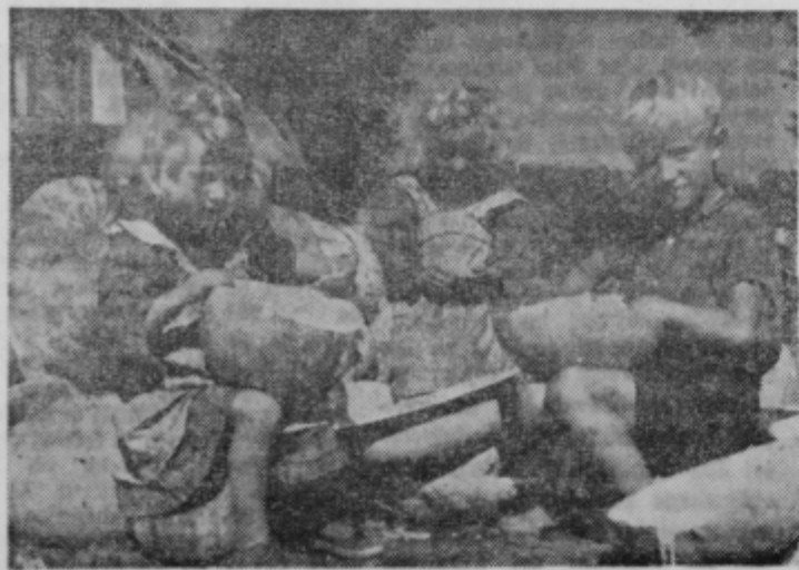
Otrokom s pvedželja mine marsikatera prosta ura pri čiščenju buč. Po zamenjavi bučnic radi jedo čebulo in solate s prvovrstnim učnim oljem.

I. Kobila Libojka — 4 leta II. Kobila Vitka — 8 let. — Konjski klub »Zagreb«