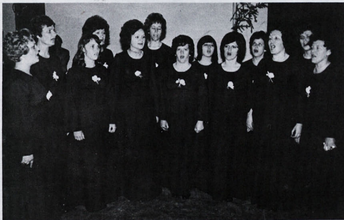
Iz skromnega začetka se je v LIBNI razvil že pravi pevski zbor. Na letošnji proslavi 8. marca je zbor požel zasluženo priznanje.