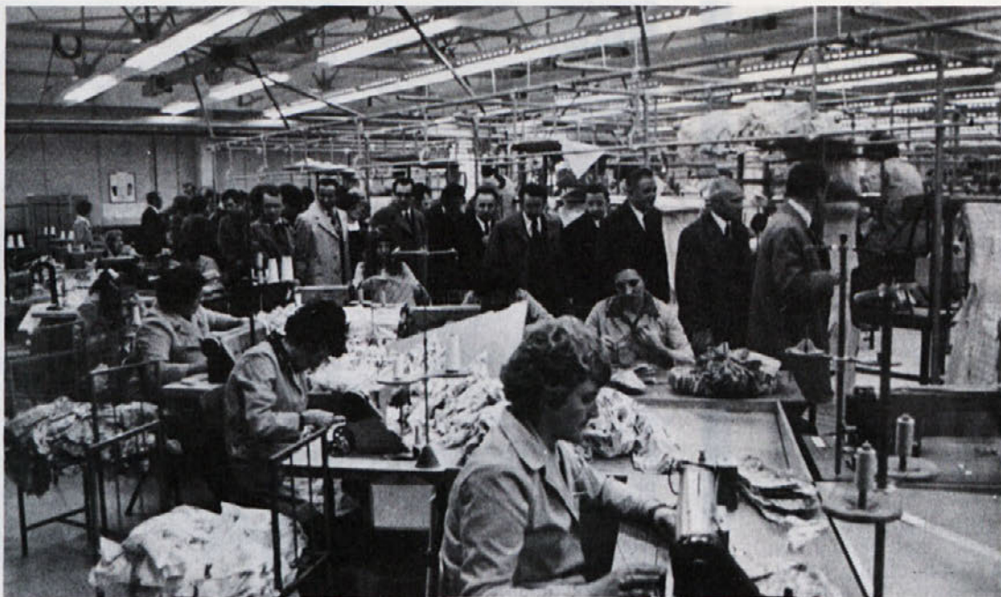
V novih prostorih tovarne v Ptujju je stekla proizvodnja po že preizkušenih tehnoloških rešitvah. Viseči sistem je prav gotovo ena izmed novosti v proizvodnji.

In na koncu si zastavimo vprašanje, kaj nam produktivnost pomeni. Redkost dobrin in naše potrebe nas silijo, da gospodarno uporabljamo vse dobrine. Naš primer nam pove, da je prva brigada bolj smotno in gospodarno uporabila sredstva in čas za izdelavo 5000 srajc. Proizvajati cenjeje v čim krajšem času ob primer-ni kvaliteti pa je ena od naših osnovnih nalog.