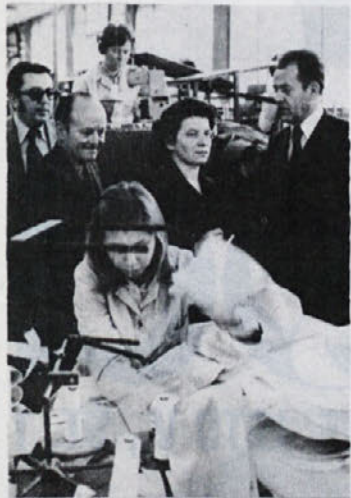
Slika na naslovni strani: Obisk romunske sindikalne delegacije 5. februarja 1975.

Sindikati ima pravico in obveznost, da sodeluje pri urejanju, uveljavljanju in varstvu vseh pravic iz združenega dela. To še ne pomeni, da sindikat lahko odloča o teh vprašanjih. O vseh vprašanjih urejanja in uveljavljanja pravic in obveznosti odločajo delavci v temeljni organizaciji oziroma organi, neposredno voljeni od delavcev.