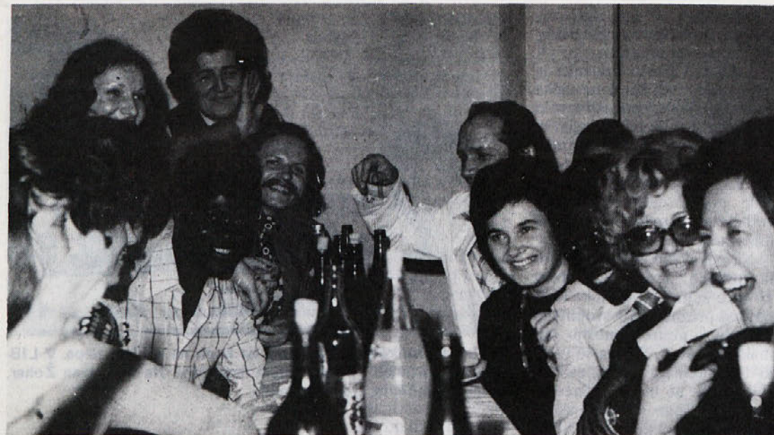
Mlada Ugandca sta se na proslavi 8. marca v Novem mestu počutila tako, kot da sta med starimi znanci.