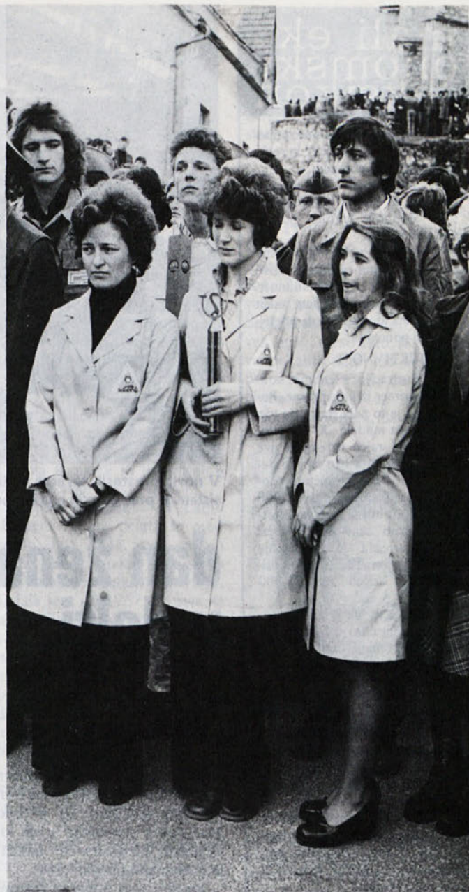
Štafari mladosti smo se pridružili s svojo štafetno palico

Vsem, ki so opravile izpit, iskreno čestitamo!