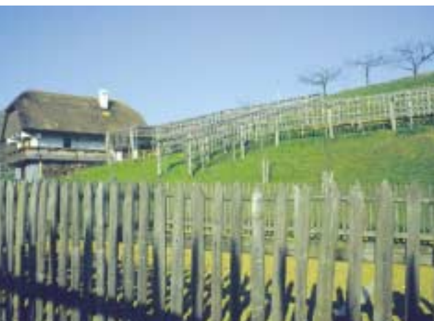
Muzej na prostem ob poti iz Rogatca na Donačko goro

Haloze so že njega dni pomenile sinonim za revščino, bedo in vsakovrstno materialno ubornost, kar ni bilo iz trte izvito. Skromne bajtice in viničarije in veliko več otrok, kot bi jih takrat (pa menda še bolj danes) mogli spodobno preživeti. Pa so vendar Haložani sloveli kot dobri in prisrčni ljudje. Preprostost je vedno prisrčna, nekaj malega pa jim je pri tem pomagala tudi zlahтна kapljica, ki je je tod že pregovorno v izobilju iztisnila svojevrstna pokrajina. Ena redkih stvari, na katero so lahko računali. In pa na kostanje. Včasih so bili zelo cenjeni – iz njih so pekli kruh. V zlati dobi kostanjev so jih v velikih količinah vozili v večja mesta in jih tam menjali za žito v volumenskem razmerju 1:1 – merica kostanjev za merico žita. Na tak način so brez težav prišli do zrnja, ki ga drugače nikakor ne bi mogli sami pridelati.