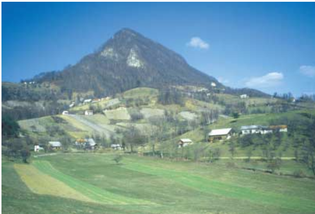
Gornja vas pod Donačko goro

Različnih netreskov poznamo zelo veliko. Zanimivo pa je, zakaj jim pravimo »netresk«. Včasih so namreč ljudje netreske vsajali v slamnate stre-