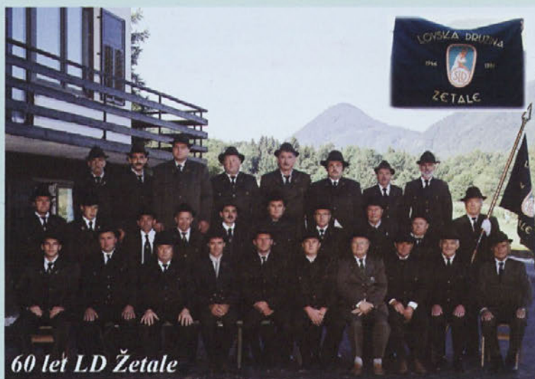
60 let LD Žetale

Letos praznuje LD Žetale 60 let svojega obstoja. Tako smo se člani LD zbrali v soboto, 16. septembra, pri Lovskem domu v Žetalah ter ob tej priložnosti pripravili slovesnost.