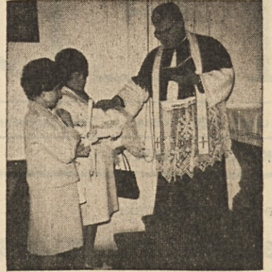
Pokojnik krščuje otroka naših izseljencev

kot izseljenski duhovnik med našimi rojaki v Zahodni Nemčiji — v Mannheimu, Frankfurtu in okoliških krajih. Obširneje bomo poročali prihodnjič.