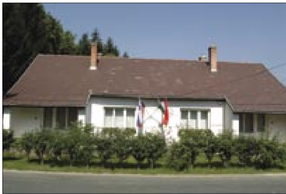
Stavba Državne slovenske samouprave na Gorenjom Seniki. Volitve v Državno slovensko samoupravo bodo sprtulejti 1. 2007

Zatok je vogrski parlament tak skončo, ka trbej volilni zakon spremeniti. Po nauvom volilnom zakoni leko 1. oktobra na manjšinski volitvaj svoj glas dolada samo tisti, steri se je dau goravzeti v manjšinski volilni register. Tau je trbelo opraviti do 15. juliuša. Mi, Slovenci, smo pri tom malo zaspali. Med trinajstimi manjšinami smo na zadnjom mesti bili. Ništernim je samo te na pamet prišlo, ka so se nej dali registrirati, gda so steli kandi-