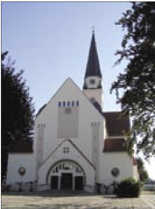
Stolna cerkev pomurske škofije v Soboti; pročelje, napravljeno po načrtaj arh. Ladislava Takatsa med 1910 in 1912

Kak pravi staro izročilo, naj bi že za časa slavskij knezov Pribine in Koclja in posvečena od solnogračkoga pūšpeka Liuprama (852) tū nindri bila prva cerkev. Gvūšno je tau nej, dapa trbej misliti na tau, ka je pri raznij delaj pri cerkvi biu najdeni antični, rimski nagrobnik, pa ešče kaj, ka vse guči kcuji tomi, ka ide za plac, gde je