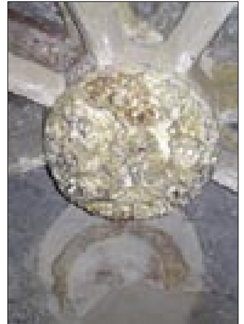
Parlerijanski sklepnik in fragment Boga očo na oboki gotsojga prezbiterijska v Soboti iz ok. 1370-80

še kcuji zazidali stranski kapejli. Vse tau, zvūn prezbiterijska, vzhodnoga cerkvenoga stolpa, fresk Matjaša Schifferja s konca 18. stoletja, pa ešče njegovoga oltarnoga kejpja s sv. Miklošom, šteri obdarūvle tri device, je kaj dosta nej ostalo po tistom, gda so napravli nauvo cerkev. Tau