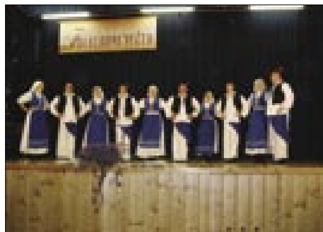
Senička folklor na bogojinskom odri

prireditve, štere organizira en pripravljalni odbor, dobile tradicionalni značaj. Tau pomeni, ka ništerne programe naredijo vsakšo leto znauva. Takšne prireditve so: Hubertova meša v Bogojini, vinnogradniški večer, zelenjadarski