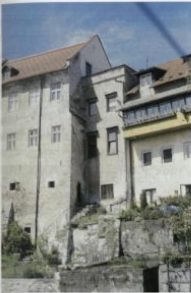
Zazidan prehod med Kajbetovo in Zofkeževo hišo.

ta dozidan del še dobro viden. Stavba je nastala na začetku 20. stoletja. Sprednji del hiše, obrnjen proti ulici, je bil še za mestnim obzidjem in se je z južno fasado držal spodnjih Poljanskih vrat. Obzidje je na tem mestu v ometu prikazano. Lontrške hiše niso bile prislonjene direktno na mestno obzidje, razen Špitala in Cvingerša. Slednji poslopji sta služili tudi kot obrambna objekta. Med hišami in obzidjem na Lontrgu so bila gospodarska poslopja in vrtički, logistični prostor. Na tem mestu ohranjeno obzidje so ostanki, na katere so pozneje prislonili gospodarska poslopja in poznejše prizidke. Še vzhodneje od obzidja pa so do Grabna segali tudi lontrški vrtički. Ti so še danes ohranjeni in k sreči nekateri nepozidani. Vzhodno od obzidja je od kašče do spodnjih Poljanskih vrat potekal vodni graben med Selščico in Poljanščico. Ime Graben za to območje se je do danes izgubilo. Pod njim pojmujejo le še zasuti suhi graben, na klancu med spodnjimi in zgornjimi mestnimi vrati, ki je danes rekonstruiran in delno viden na klancu, desno s ceste v Poljansko