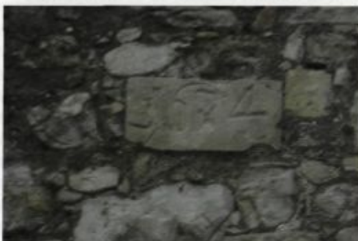
Letnica 1674, ohranjena v mestnem obzidju ob cesti v Vincarje.

vodila na vzhodu ob špitalski cerkvi Špitalska vrata. Ob mlinu pri sedanjem Šeširju so bila manj ugledna in manj pomembna Čevljarska vratca. Ime so dobila po strojarskih stopah, ki so bile na tem mestu. Iz gradu je potekalo obzidje do Selščice. V obrambni sistem je bila vključena tudi nunska kašča, kjer so odkopali del obzidja in ga obnovili, da se vidi, kako je zid na tem mestu potekal proti gradu. Selščico je zid dosegel nekje tam, kjer so leta 2002 pod cesto v Vincarje našli zasut rov. Ta rov je verjetno služil kot zasilni izhod, da so meščani lahko hodili po vodo v primeru obleganja. Obzidje do Selških vrat je še ohranjeno ob cesti v Vincarje. Nanj so v poznejših stoletjih prislonili samostanska gospodarska poslopja. Na tem delu obzidja sta ohranjeni letnici 1674 in 1727, ko so obzidje še redno popravljali in vzdrževali.