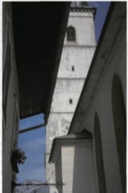
Župna cerkev sv. Jakoba, na zvoniku okrogla lina za strelno orožje.