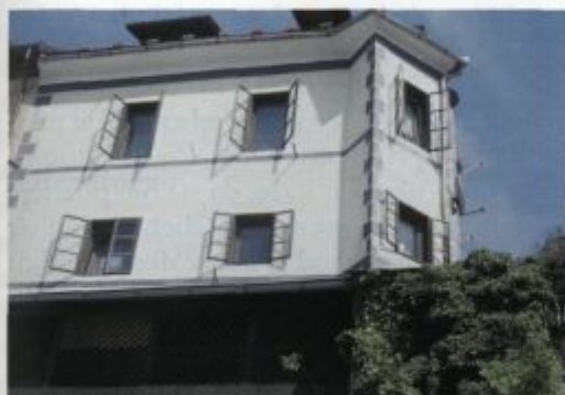
Arkadni pomol na Flisovi hiši na prehodu iz Komuna na Spodnji trg.

propadali in so postali vir gradbenega materiala. Loško mestno obzidje je bilo zasnovano že vsaj v 14. stoletju in je bilo grajeno za pehotno obrambo, oboroženo s hladnim orožjem. Zidovi so bili sorazmerno visoki in dokaj tanki in jih niso nikoli prilagodili obrambi pred topovi in drugim težkim orožjem. Drugače pa je bilo z gradom, ki ga je škof Filip po potresu 1511 opasal in podprl z debelima renesančnima stolpoma, ki sta uspešno dopolnjevala že obstoječi masivni osrednji stolp in bi se ti skupaj lahko upirali tudi topovskemu obstreljevanju.