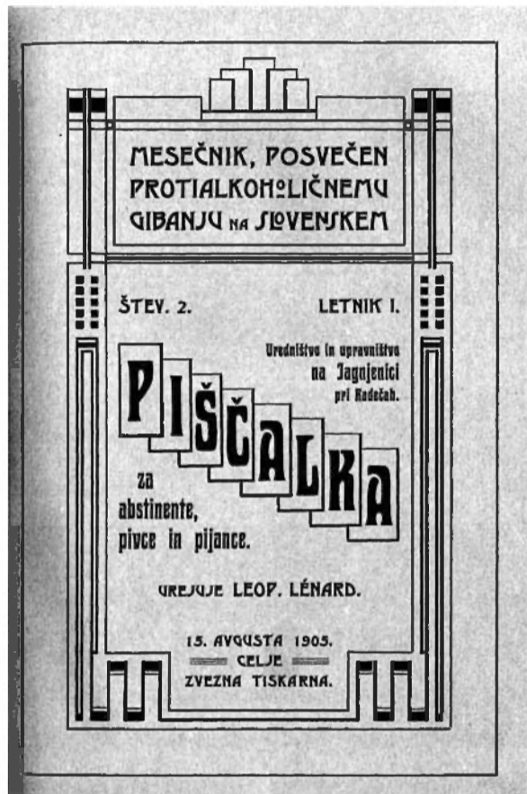
Piščalka za abstinence, pivo in pijance, let. I, št. 2

Če se ustavimo pri imenu revije, se lahko upravičeno vprašamo, zakaj tako poimenovanje. Kaj ima vendar opraviti piščalka z alkoholom oz. abstinenco? Piščalka je z moderno dobo dobila nov pomen, ni več igračka za pastirčke, temveč je naprava, ki poziva v tovarnah na delo, naznanja odmor, konec dela, odhod vlaka ipd. Prav tako neznanja tudi nevarnost – prav taka nevarnost pa je za človeka alkohol. Piščalka torej poziva v boj proti sovražniku alkoholu. 17