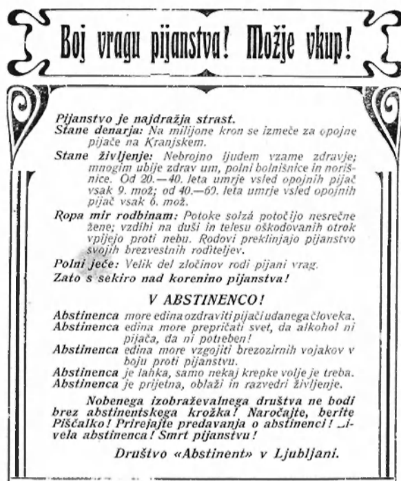
Boj vragu pijanstva! (Piščalka, let. I, št. 6)