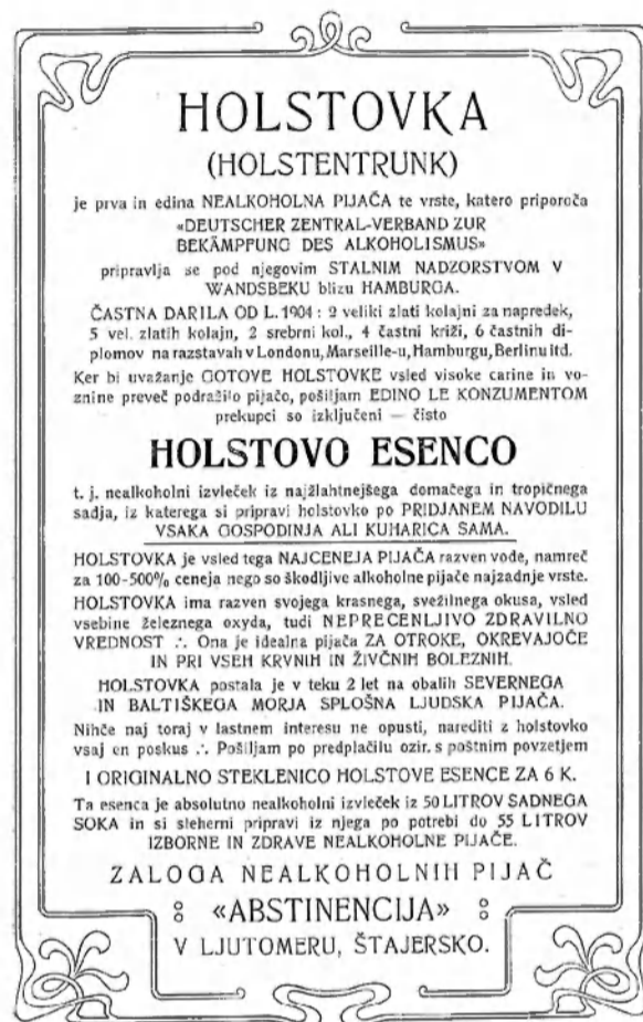
Holstovka (Piščalka, let. II, št. 8)

Tratnik, ki je bodoče stranke vabila, da so »prostorij prav prijetni in udobni«, prav tako pa »bode vedno preskrbljeno za dobro hrano in na razpolago razne brezalkoholne pijače.« 39