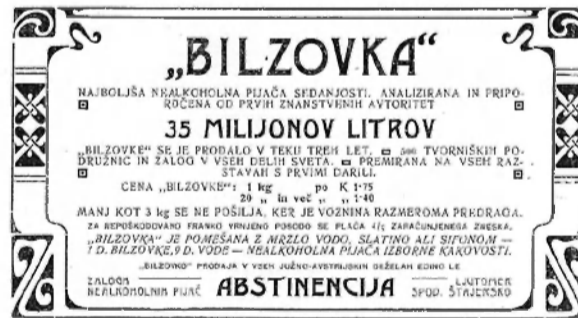
Bilzovka ( Piščalka , let. I, št.3)

Piščalka je propagirala tudi alternative alkoholu. To sta bili nealkoholna pijača »Bilzovka« in »Holstovka«, ki sta bili pravzaprav sirupa za mešanje z vodo. V reviji je bilo objavljenih več reklam za omenjeni »izborni alkoholni pijači«, žal pa ni podatkov, koliko sta si dejansko utrli pot do slovenskih grl.