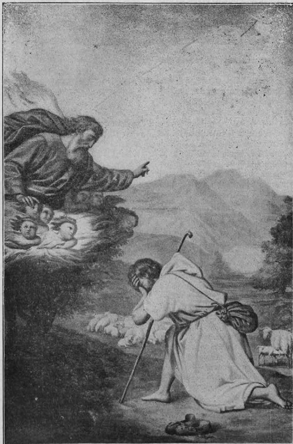
Mojzes dobi naročilo, naj gre v Egipt in reši svoj narod iz sužnosti.