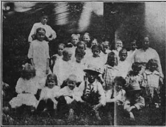
Slovenski otroci v Dodson, Md. s svojo učiteljico.

K vprašanju o naših "katoliških" jednotah. O J. S. K. Jedn. piše v "Glas Naroda" neki dopisnik te-le krasne besede, katere zaslužijo, da jih ohranimo v našem listu.