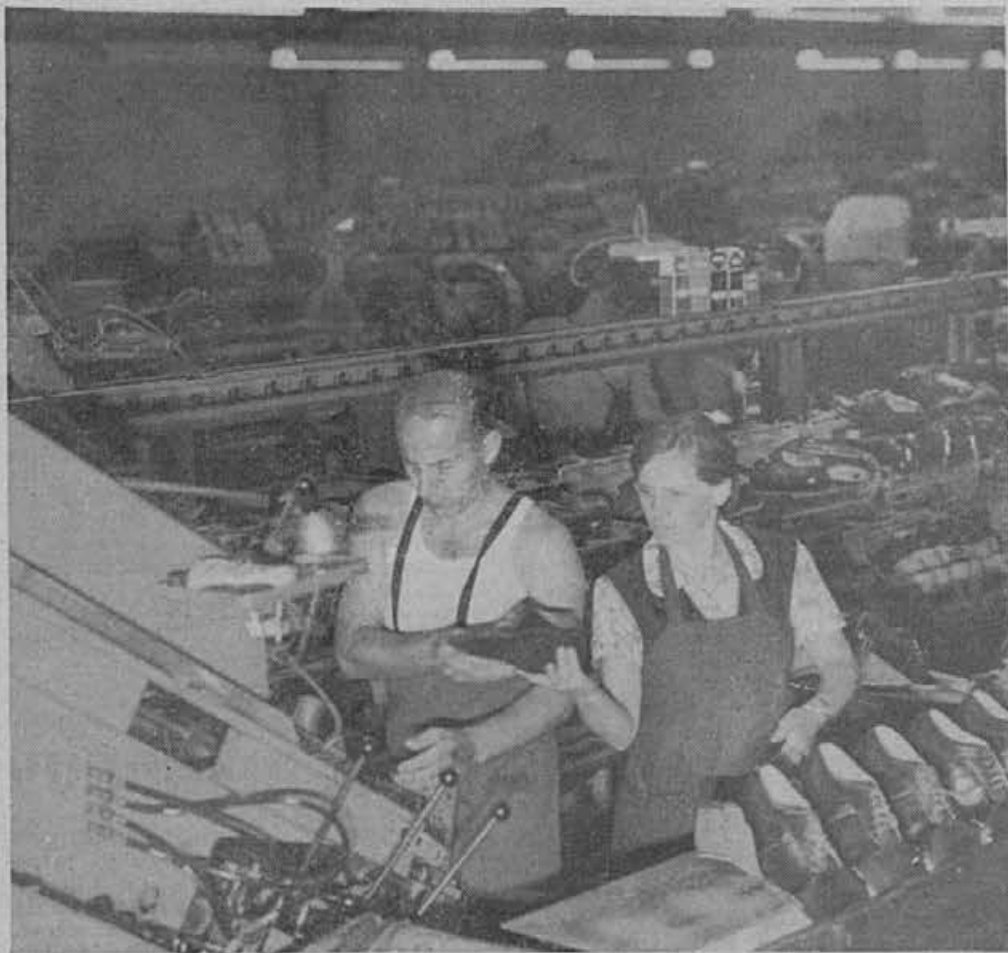
O ustanovitvi TOZD odločajo zainteresirani delavci sami. Nihče ne more sprejeti takšne odločitve »v imenu delavcev«