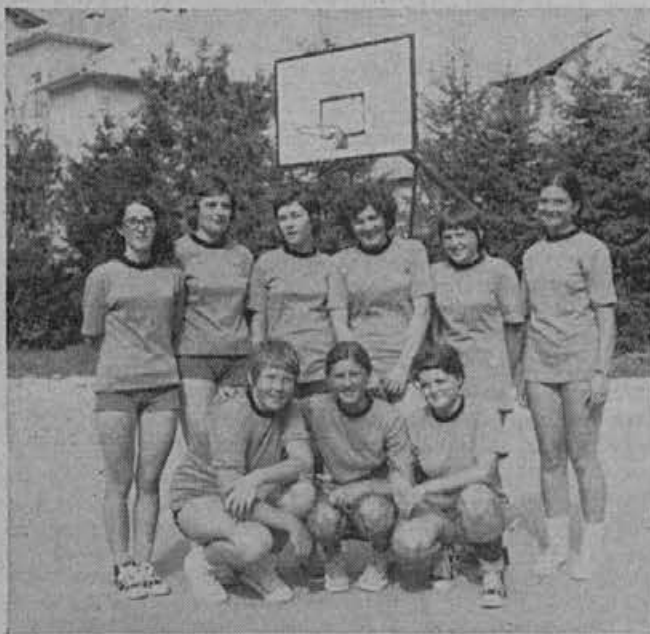
Članska ekipa žirovskih košarkaric

Odgovore pošljite do 29. septembra 1972. Pogoji: največ pet besed.