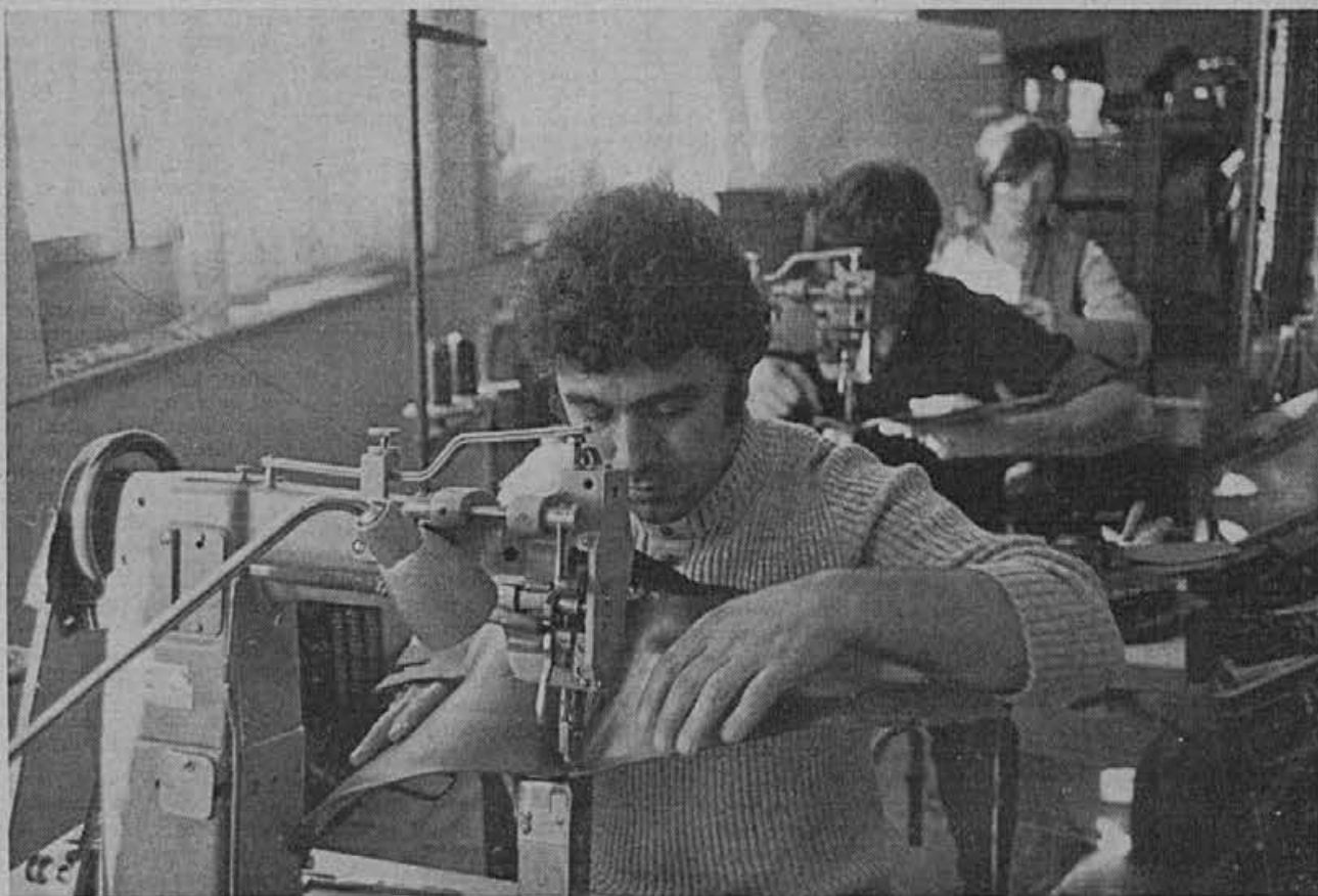
Materiali za smučarske čevlje so trdi in zahtevajo močnejše roke