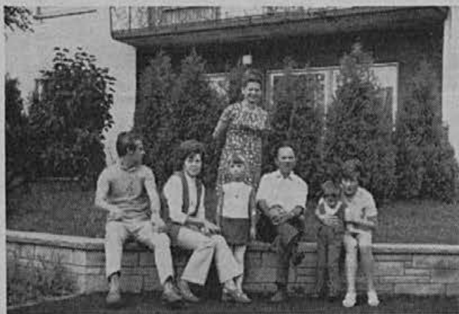
Pri sorodnikih v Nöttingenu

Pforzheim, središče nemškega zlatarstva in draguljarstva, je bil med vojno popolnoma porušen. V spomin na minulo vojno so iz ruševin napravili umeten hrib južno