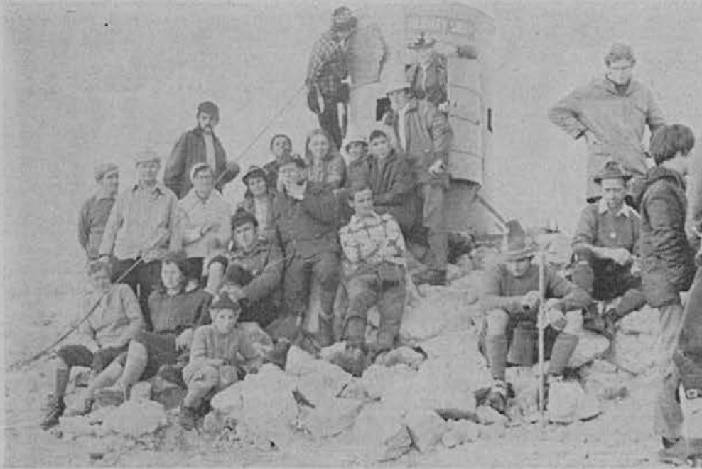
Naši planinci na vrhu Triglava

Potem, moj Eros, cvetu cvet pomore iz večnih senc, iz dantejevske more; potem srce si v srcu najde sled utehe.