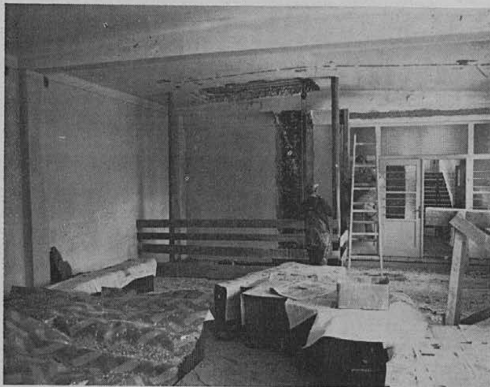
Danes je na žirovski osnovni šoli že vse »nared« in so učilnice polne učencev. Kako pa je bilo pred dobrim mesecem, ko je bilo preurejanje na višku, nam kaže gornja slika

Iz gornjega članka, ki je bil objavljen v Gospodarskem vestniku dne 11. 8. 1972, je razvidno, da se nam v preskrbi za osnovnimi surovinami obetajo še težji časi. Dobri