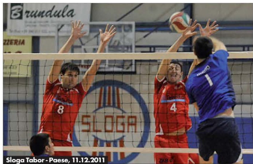
Sloga Tabor - Paese, 11.12.2011