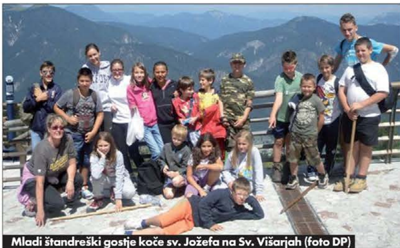
Mladi štandreski gostje koče sv. Jožefa na Sv. Višarjah

tudi osebnih stroškov, saj koča ni tu v Gorici za vogalom, za "božji lon in narodov blagor" izredno skrbno, vestno in natančno opravlja Čotar že sedemindeset let. Zato je že izrazil željo, da bi kak mlajši prevzel to oskrbovanje. V teh letih je ta dom sredi gorskega sveta v notranjosti in zunanosti doživel kar nekaj nujnih opravil in posodobitev. Prvič je bilo treba odstraniti črvice tramove in v prvem nadstropju zgraditi železobetonsko ploščo l. 1977, saj potres l. 1976 ni prizanesel niti koči. L. 1996, ko so na pobočju pod njo zgradili vrsto hiš, je bila koča povezana na vodovod in plinsko omrežje. L. 1998 je zaradi tega njena notranjščina postala bolj udobna. Do tedaj v njej ni bilo tekoče vode. V njej so zgradili lepo kopalnico s prho, prenovili stopnišče in postavili nove plošči-