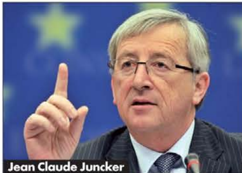
Jean Claude Juncker

bonitetne ocene), na hude čase, ki so pred Slovenijo, je prejšnji teden opozoril generalni sekretar OECD Angel Gurria (ob tem se je Gurria tudi strinjal s predvidenimi posegi, ki jih načrtuje Janševa vlada), v ponedeljek pa je predsedniku slovenske vlade jasno povedal, da slovenska država ne sme več izgubljati časa, še predsednik evrske skupine Jean Claude Juncker.