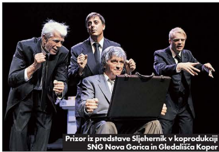
Prizor iz predstave Sljehernik v koprodukciji SNG Nova Gorica in Gledališča Koper