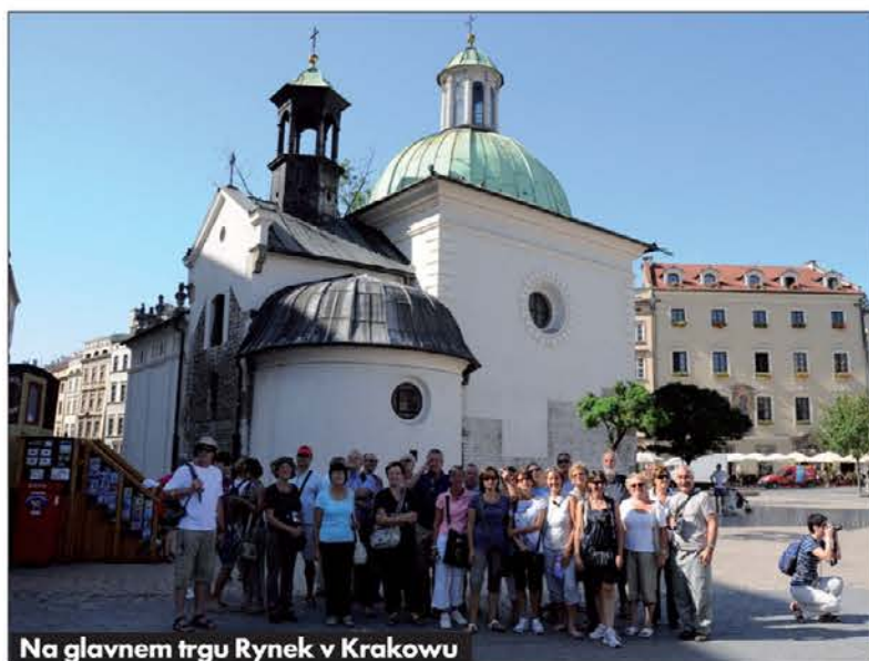
Na glavnem trgu Rynek v Krakovu

ali priredili v koncertne dvorane ali celo cerkve, kjer pogosto prirejajo obrede ali imajo celo poroke. V največji dvorani, ki je spremenjena v pravcato notranjost cerkve,