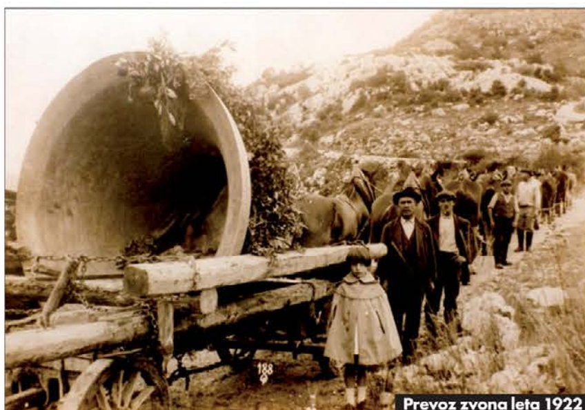
Prevoz zvona leta 1922

mane in vse prisotne sprejeli pritrkovalci, ki bodo pritrkavali na svetogorske zvonove. Le-ti se bodo zaradi prenove nosilne konstrukcije, elektrifikacije in strelododov oglašili po petmesečnem premoru.