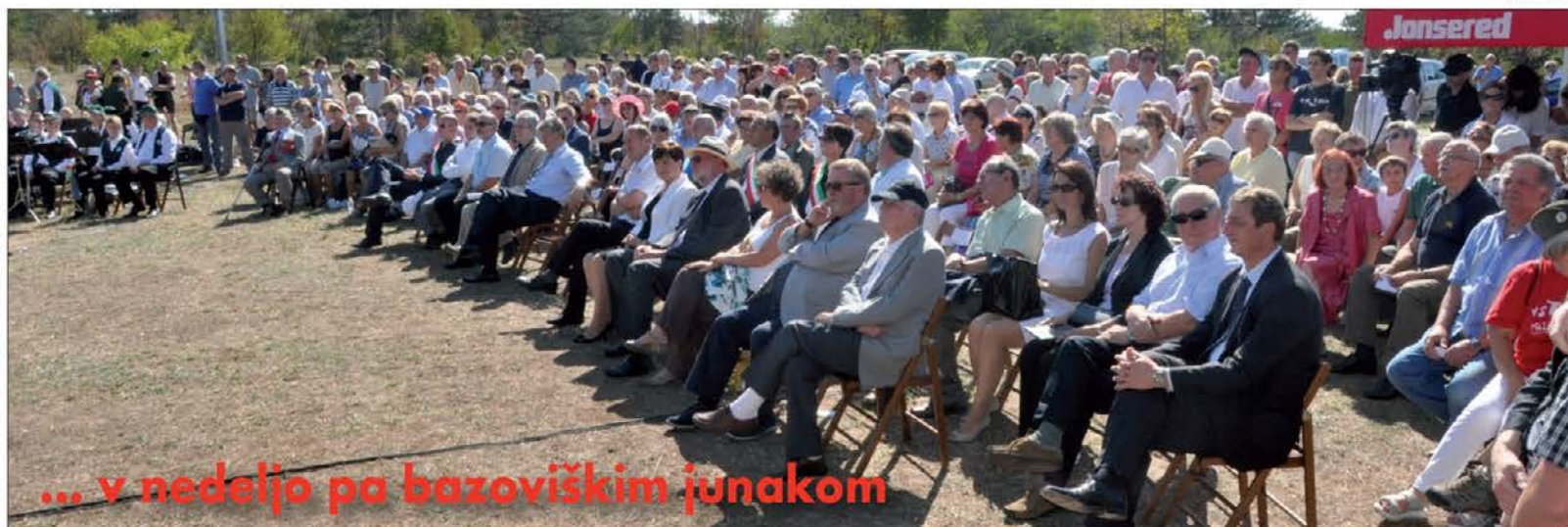
... v nedeljo pa bazoviškimi junakom