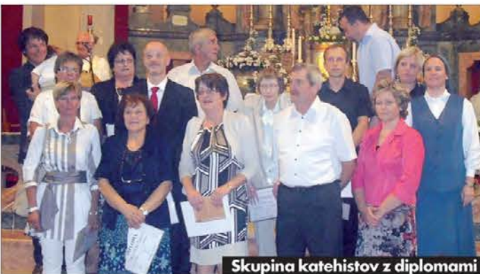
Skupina katehistov z diplomami