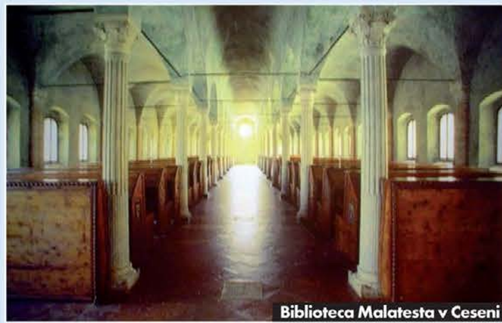
Biblioteca Malatesta v Ceseni