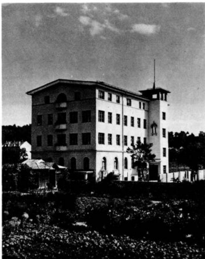
Novi dom duhovnih vaj pri Lichtenthurnovem zavodu v Ljubljani

»Svete bojazni za svoje posvečenje nam je resnično treba, kajti le prerado se pozablja na najvišji cilj. Vendar nas pravtako mora tolažiti krščanska zavest: da je vsaka udeležba pri svetnem delu, vsaka kulturna dejavnost — od Boga poslano zvanje. Vestno izvrševanje svojega poklica je pa resnično