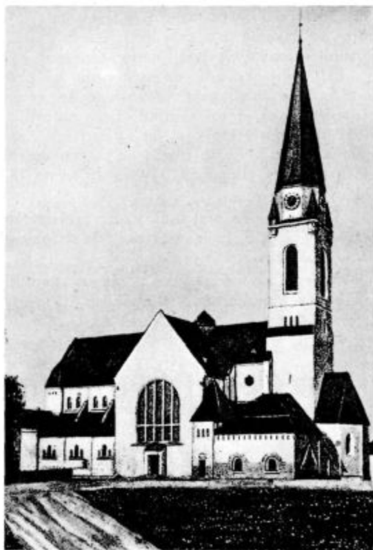
Rim. katol. cerkev v Murški Soboti

»Vse lepo in jasno; toda za današnje čase, ko je sveti Cerkvi treba predvsem duhovnih delavcev, se mi zdi, da se spričo vaše telesne zaposlenosti vaše duhovne moči dajo premalo razviti in misijonsko izčrpati.«