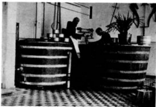
Stična: Bratje laiki pri delu v mlekarni

omejenem krogu. V pojasnilo bodi pa še to: Bratje laiki niti najmanj niso kako brezpravno orodje, marveč imajo v opatu svojega najboljšega očeta, h kateremu imajo vedno svoboden dostop in kateremu morejo glede česar koli svobodno izraziti svoje mnenje ali pa kakšne pomisleke. In tudi sam predstojnik poleg konventa v mnogih zadevah za svet vprašuje zdaj pa zdaj še brate konverze, katerih misel mu je prav dragocena, saj so mnogi v svojih področjih strokovnjaki. In če sem vam že omenil tu pa tam očitani »ozko omejeni krog«, vam moram razodeti tudi njega resnično lice, da žive bratje laiki prav lepo, zavidanja vredno življenje. Ne samo, da se njihovo delo in skupna molitev in duhovne vežbe modro izmenjujejo, marveč imajo bratje konverzi še dovolj prilik za svoje duševno izobraževanje, za odmor, bratski pogovor in tudi za zabavo. Nardarjenim in vestnim bratom laikom predstojnik radevolje daje tudi možnost, da se kaki stroki posebno posvete in v njej spopolnijo. In tudi umetniško se lahko udeležujejo, če imajo za to talent. Samo, da se v vsem proslavlja Bog!