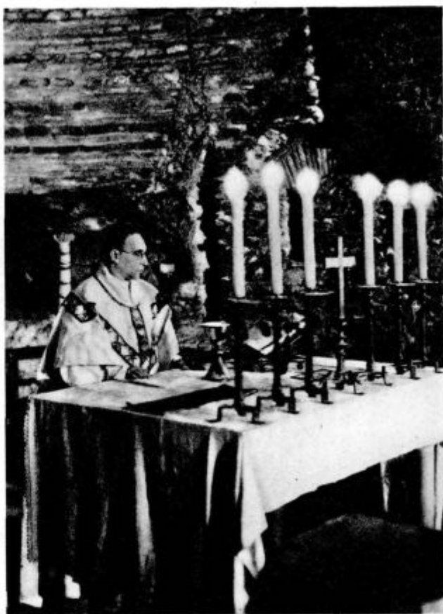
Sv. maša na grobu mučencev (Katakombe sv. Domitile)

Skoraj povsod opažamo, da se verniki trkajo na prsi namesto v litanijah pri be-