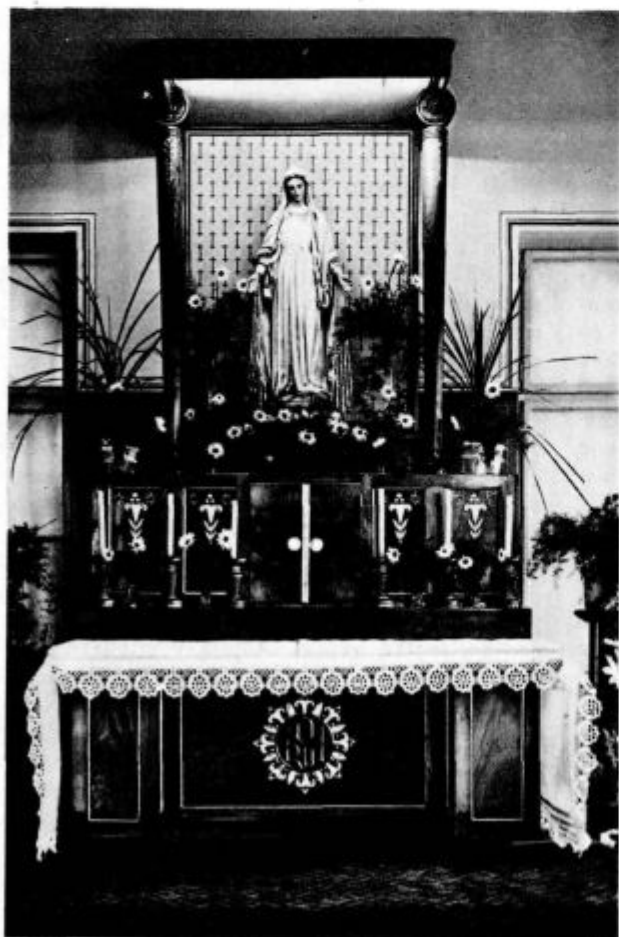
Oltar v dvorani doma duh. vaj

»Starši mi niso ničesar povedali. Čislam in spoštujem vašo hišo; toda ne zanašajte se nič ne! Vzajem ga ne. Ne morem.«