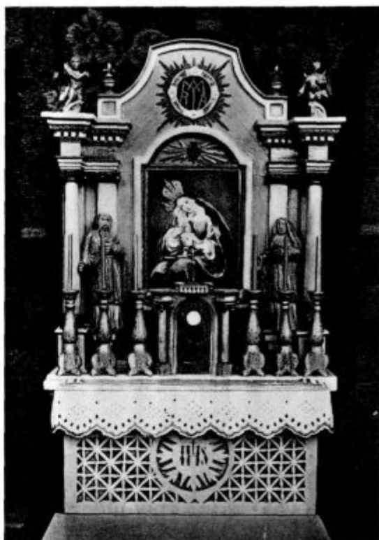
Posnetek Mar. oltarja na Brezjah (Izrezljal Fr. Bokalič iz lesa. Viš. 40 cm)

»Res, če si samostan hočete predstavljati kot navadno svetno družbo, potem bi kajpak že različnost v naši redovni obleki nudila izrazito sliko socialne neenakosti, koliko bolj še le krogi udejstvovanja! Pa moram poudariti, da je povsem napačno mnenje tistih, ki bi hoteli v naših bratih laikih imeti le nekake naše postrežčke ali hlapce! Veste, svoje celice in opremo v njih si pospravljamo in urejamo patri kar sami. Delo bratov laikov se vrši na važnejših področjih ekonomije: na polju in vrtovih, na žagi, v mlinu, mlekarni, kuhinji, raznih delavnicah in drugod po samostanu. Na zunaj je res morda videz, kot da so le navadni dninarji, toda mi gledamo in vrednotimo v njih neprimerno več: naše drage, vsega spoštovanja in ljubezni vredne duhovne sobrate v Kristusu. Tudi oni so pravi redovniki! Saj se po šestmesečni dobi kandidatstva z redovno obleko in novim redovnim imenom vpricho vse samostanske družine sprejmejo v novicijat. Ob letu pa po prestani preizkusni dobi napravijo svete zaobljube in se tako po-