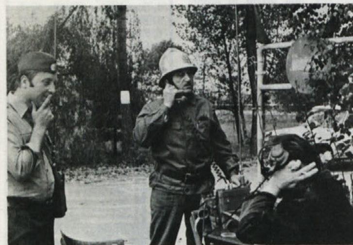
Hitro ukrepanje, nesebična pomoč in požrtvovalnost naših ljudi je že velikokrat rešila družbeno in zasebno lastnino. Ljudje, ki stoje na straži dan in noč, zaslužijo spoštovanje in zahvalo.