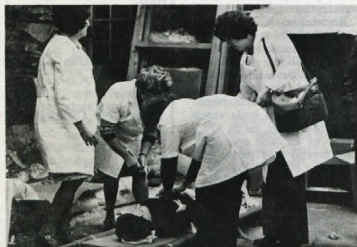
Ekipe prve pomoči so na nedeljski vaji pokazale veliko znanja in spretnosti. Navideznim ranjencem so nudili hitro in učinkovito pomoč. Dekleta so pripravljena, da le kaj.