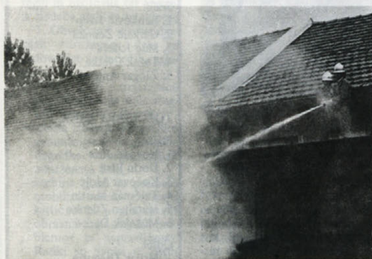
Na vaji, posvečeni tednu varnosti in 20-letnici obstoja industrijskega gasilskega društva Beti, so poleg domačih gasilcev sodelovali tudi gasilci iz hrvatske občine Ozalj. Vaja je zelo uspela.