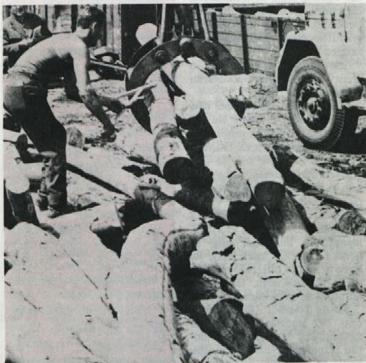
Zima že pošteno pritiska in zadnji lepi sončni dnevi so mimo. Nekatere je sonce tako začaralo, da so pozabili na drva in verjetno si marsikdo od bralcev, ki vidi na današnjem posnetku kurivo, zaželi, da bi drva ležala na njegovem dvorišču.

Takšno mišljenje bi morali izkoreniniti iz naše sredine.