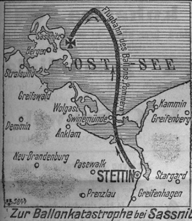
Zur Ballonkatastrophe bei Sassnitz

telj na 7 učencev) in košta na leto 100.000 kron davčnega denarja! Za popolnoma nepotrebni licej za hčerke bogatinov v Ljubljani izdaja občina na leto 50.000 K. Ljudstvo se grozno hujska na učitelje (strelja se celo nanje), itd. itd. Z eno besedo povedano: Knjižica je iz vrstna in jo toplo priporočamo vsakomur, ki se hoče o „kulturnih razmerah“ na Kranjskem podučiti.