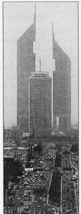
Promet v Dubaju in Emirates Towers, najvišja stavba na Arabskem polotoku

Ko se boste po ulicah Dubaia prvič sprehajali, vas bo morda presenetila sodobna arhitek-