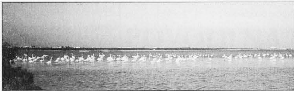
V bližini mesta preživljajo zimo flamingi

Kanal ali majhno pristanišče deli poslovni Dubai na dva dela - na severu je Deira, na jugu pa Bur Dubai. Oba bregova sta povezana s tunelom in dvema večjima mostoma, v obeh delih mesta pa si lahko ogledate mošeje, tržnice, poslovne stavbe in nakupovalna središča. Južni del mesta postaja vse bolj znan, saj se Bur Dubai nadaljuje in razširja v dele mesta, imenovane Satwa, Jumeirah in Um Suqeim. Kanal se v notranjosti zaključuje z zalivom, v katerem je mogoče opazovati številne vrste ptic, zaradi česar je to območje razglašeno za naravni rezervat. In če boste imeli srečo, boste lahko opazovali flaminge, ki se v Dubaju najraje zadržujejo v zimskih mesecih.