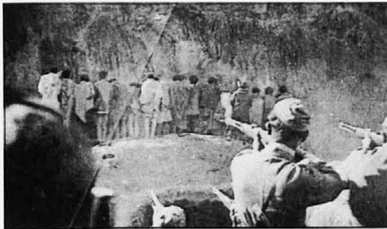
Po atentatu na maršala Grazianija so italijanske okupacijske oblasti v Etiopiji aretirale večjo skupino mladih etiopskih častnikov, ki so se bili izšolali v Veliki Britaniji. Za represalijo so jih dale postreliti.