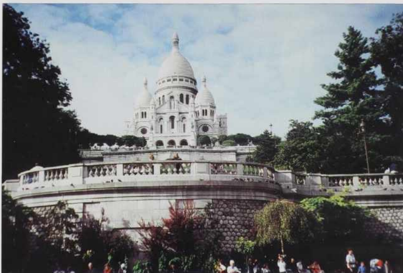
Sacré Coeur, cerkev Jezušovoga srca

Prva kak smo šli v Pariz, sam se pripravlo, kak kakša noseča ženska, ka malo ponovim tisto malo, ka sam se in da svejta navčo francuski od svoji alžirski pajdašov, ka mo kaj znau pitati. Sam se pripravlo, sam se kitöno, sam se mezdo - pa naslednje zmeto, sam povrgo. Skor tak sam biu, kak pojbiček, šteri je takšoga što prd- niti, kak