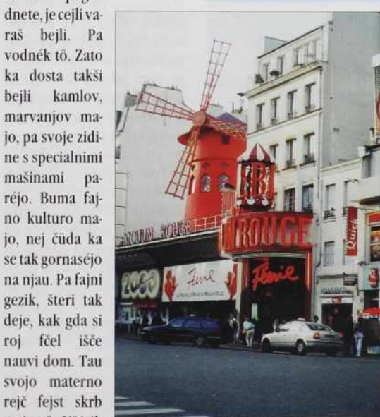
Moulin Rouge in mulin ruž

cejlom svejti znanom muzeji Louvre napriliko po stenaj vse samo francuski piše,