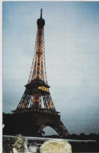
Na Eifflovom törmi po večeraj 50 gezaro grüšk gori.

prišli, pa smo vidli telko taksinov vküper, kak smo nej vidli cejlo življenje. Blokade, demonstracije zavolo dragoga dizela. Najbole vausko