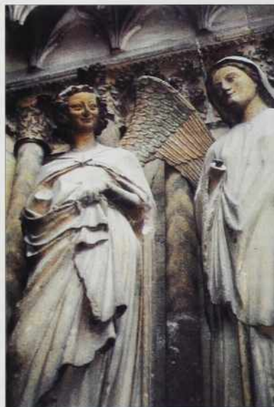
V Reimsi: Angeu boži čuvar möj, vsigder tak veseli boj!

Pa kak se nam eške tau nej vidlo, ka je kakši dragi! Mon cher ami, tres cher! Ali pa so samo naše plače lagve?