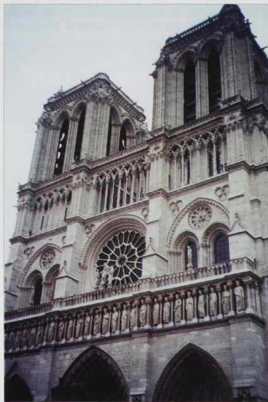
Cerkev Notre Dame - francuska gotika je zidala cerkve brezi törmov

„Pariž je vreden eno mešo.“ Tau je prej pravo Henrik IV., da je formalno püsto svojo proteštantsko vöro, in se je dau krstiti za katoličana zato, ka naj bi leko grato francuski krau.