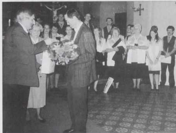
Členi društva se zavalijo gospaudi Kozari za sveto mešo

Tau bi leko društví nauve cilje, nauvi zagon (lendület) dalo, s tejm bi se leko dosegnilo, da bi se slovenska rejč nej zgibila v Pešti to nej. Vejpa kak ji več pravi, v Pešti med Madžari je teško ostati Slovenec, če ne dobíš nove impulze. M. Sukič