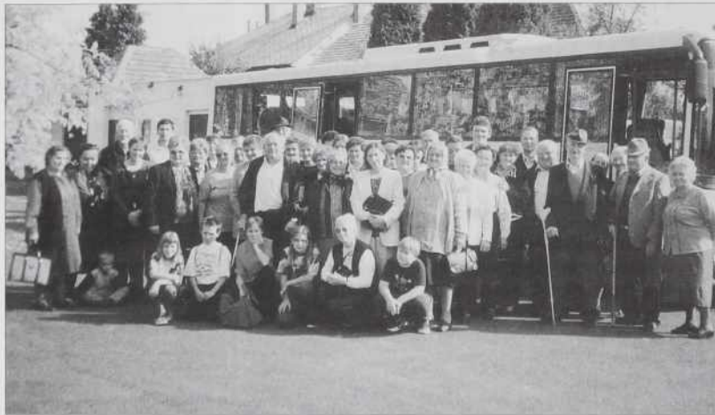
Prauškarge iz Kančevca v Somboteli

to je tiste, ki so se pripravili na krst. Starši se s tem njegovim korakom niso strinjali. Njegova priprava na krst je trpela šest lejt. Kak 15-letni je mogo v rimsko vojsko, ka je biu sin sodaka, oficirja.