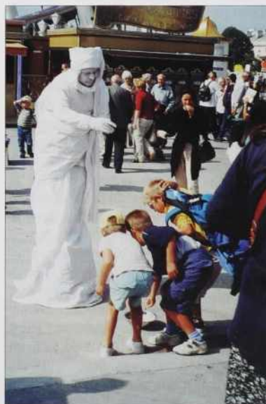
Živi kip (szobor) se za drauvne penaze tó zavali

Francuzi pa ne poštüjejo samo svetnike, liki „svetnice“ tó, tiste, štere najdete v ižaj z rdečimi posvejtami ali v Rdečom mlini (Moulin Rou-