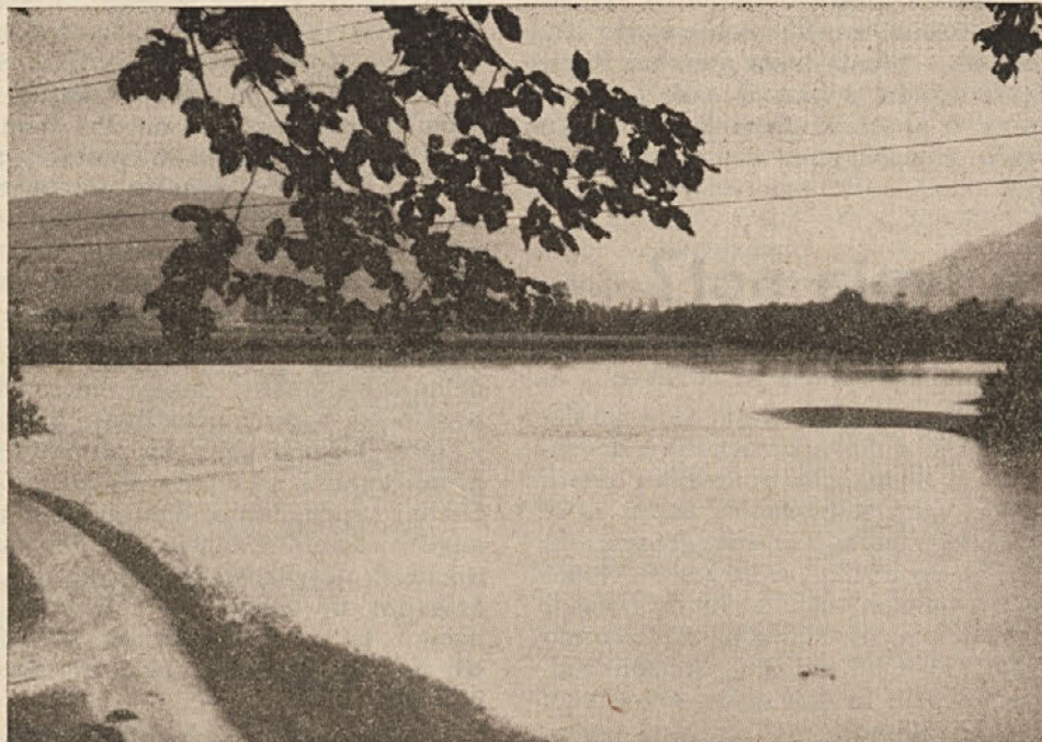
Pogled na preplavljeno polje petih vasi župnije Podgrad.

Težka je nesreča poplav na Tirolskem in gornjem Koroškem, na južnem Koroškem pa je najbolj prizadeta občina Medgorje s petimi vasi ob Dravi. Nihče ni imel svojih polj in travnikov zavarovanih pred nesrečo poplave, kot ima vsak posest-