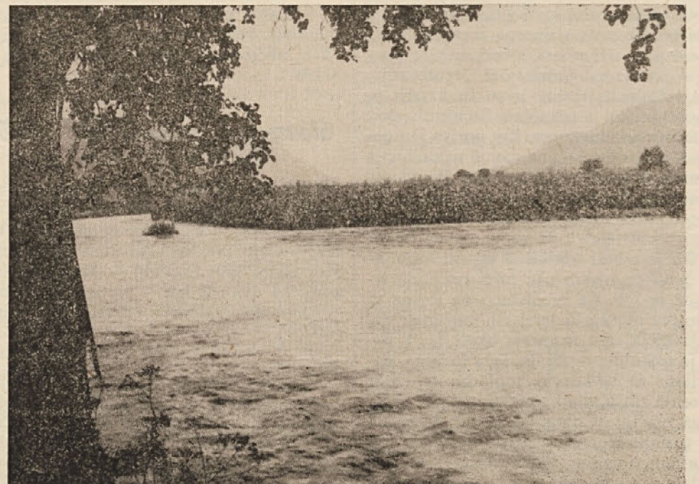
Kjer so nekdanji zreli sadovi dela in trpljenja naših ljudi, je zdaj vse razdejano in uničeno.