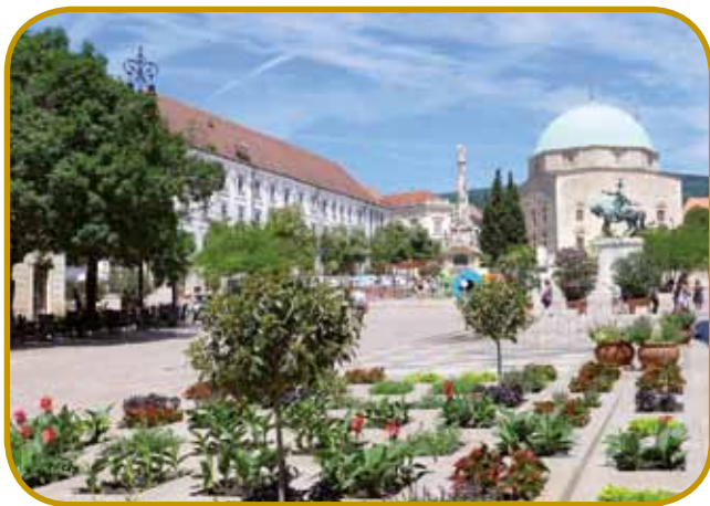
Széchenyina trg v Pécsi sprtoleti – originalno krščanjsko cerkev so v džamijo prejkzozidali v 1560-i lejtaj

vogrski krau je baratom zadau pelanje djužnoga tala rosaga. Ranč tak pod Zengönom, v ednoj vauskoj dolini se med gračenki in sadovnjaki skriva vesnica Zengővárkony . V njejoj etnološkoj zbirki najdemo dosta okinčani djajec, štere so vküppopbrali zveksoga v Karpatskom bazeni, depa v drügi mejstaj Evrope tö. Erične so