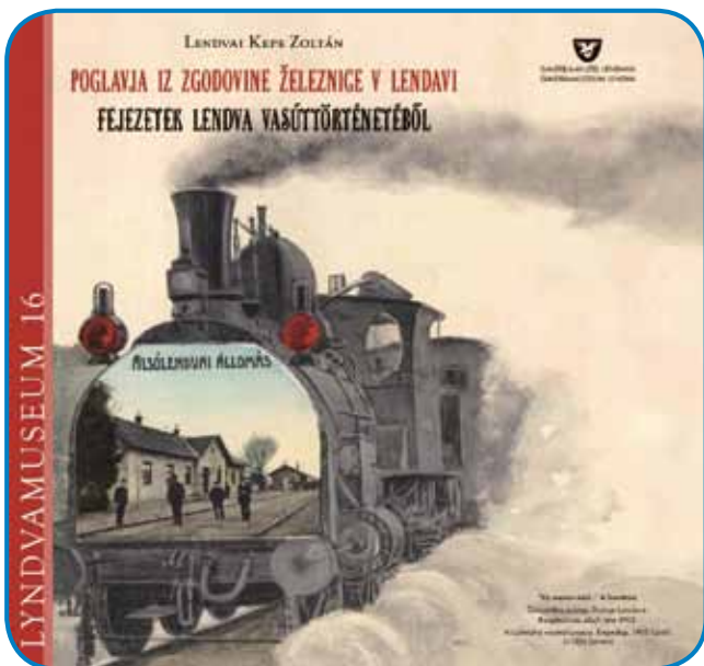
Naslovna stran publikacije, ki jo je izdala Galerija-Muzej Lendava

okolice. Proga skozi Lendavo je pomenila povezavo od vzhoda Evrope do Jadranskega morja. 121,5 kilometra dolga povezava Ukk - Čakovec je šla še skozi Zalaegerszeg, Lenti in Mursko Sre-