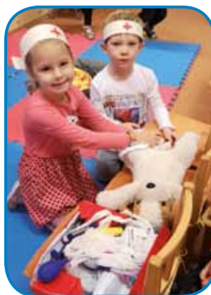
Dva zdravnika v vrtcu Sakalovci

Naučili smo se nove pesmice in deklamacije ter si v igralnici pripravili pravo ambulanto z zdravniki in pacienti.