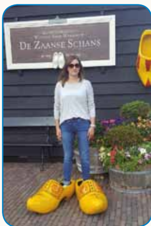
»Istina je gé, ... stran 4