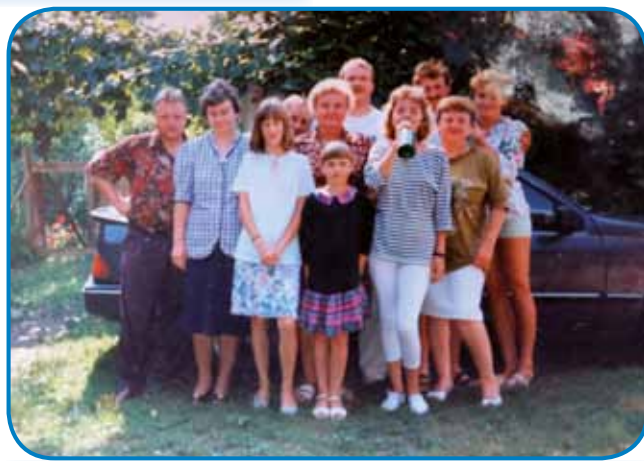
»Velka« držina Šamu; z možaum sta mela dva sina pa dveji čeri

»Ge ne mislim, ka bi nevoškēni bili, vejpa bilau je zavole dekel, steri je sto, vsikši si je najšo. Gnauk edno deklo je eden sodak sto vzeti za ženo, zato ka fejt sta se radiva mela. Stariške so fejt vcujstapili, ka te sodak je nej z naše vōre pa te sta se srmaka nej mogla zdati. Depa etak je tō nej bilau dobro, dekla je začnila piti pa mlado mrla.