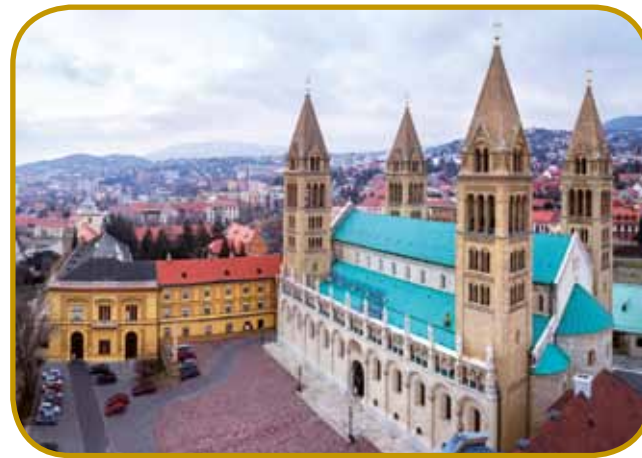
Katedrala püšpekije v Pécsi, ozajek z bregami Mecseka – svojo končno formo je dobila do konca 19. stoletja

V cajtaj pred epidemijov je bila ulica Király vsikdar puna, s svojimi glasnimi terasami je spominala na mediteranske varaše. Po njej leko pridemo do Narodnoga gledališča, gde so meli šegau vsikšoga juniuša držati državno gledališko srečanje (POSZT). Pécs je veuki center Rovatov na Madžarskom, tau svedoči Hrvaško gledališče v središči varaša tö. Eden veuki kulturni center pa so napravili na pet hektaraj v fabriki Zsolnay, gde najdemo 15 spomeniško zavarovani zidin ino 88 kipov s keramike. Šega je bila, ka so v fabriki vsik-