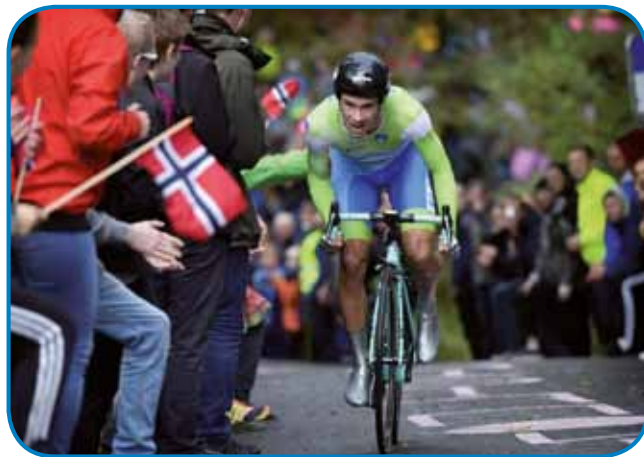
Tak je Primož Roglič vozo piciklin na pauti do srebrne medalje na svetovnon prvenstvi na Norveškon leta 2017.

V letošnjem leti, gda je zavolo nauvoga koronavirusa odpadno dosta športnih tekmovanj, so profesionalni piciklisti vseeno pod strejo spravili tri velka, trikedenska tekmovanja, Tour de France, Giro d'Italia in Vuelto. Dvej od tej trej tekmovanj sta gvinila Slovenca. V Franciji je žuto majco na konci obleko Tadej Pogačar, steri je predzadnji den na kronometri prehito Primoža