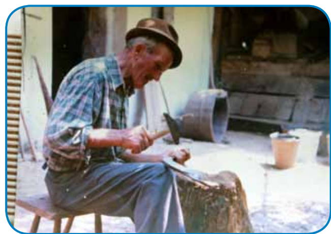
Oče kosau klepajo