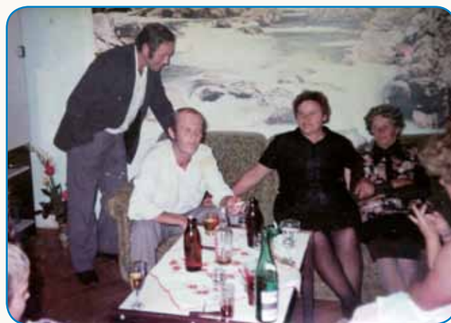
Dočas si mladi, je vse dobro stran 8