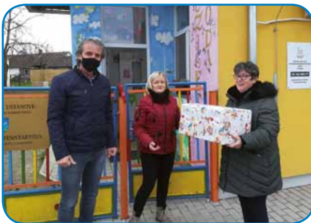
Predaja daril v Vrtcu Sakalovci

Komisija za šolstvo DSS je tudi v letošnjem letu načrtovala več aktivnosti v šolah in vrtcih, za omenjene aktivnosti je imela tudi proračunska sredstva. Zaradi epidemije Covid 19 večine