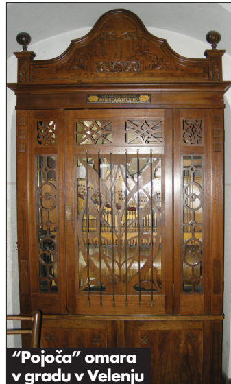
"Pojoča" omara v gradu v Velenju

smučarsko skakalni center, pokrit zimski bazen, pa tudi turistično rekreacijsko območje ob jezeru na predelu ugrezninskih jezer, ki so nastala ob izkopavanju premoga. Mesto ima polno zelenja. Na trgu stoji še ogromen spomenik maršala Tita (nekoč se je imenovalo Titovo Velenje). V začetku so v zgrajenih blokkih, polnih svetlobe, živeli večinoma rudarji. Še zdaj so prebivalci mesta Velenje rudarji ali pa so zaposleni