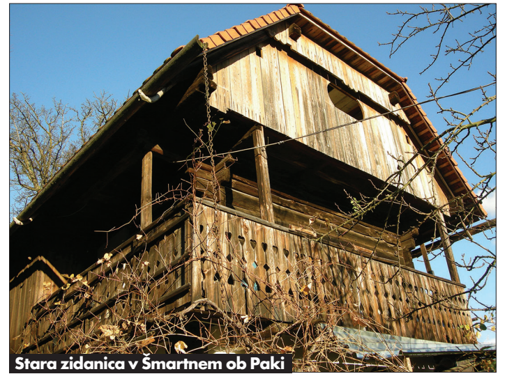
Stara zidanica v Šmartnem ob Paki