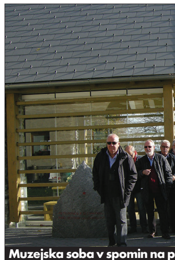
Muzejska soba v spomin na pesnika Karla Destovnika - Kajuha

muzejsko skakalni center, pokrit zimski bazen, pa tudi turistično rekreacijsko območje ob jezeru na predelu ugrezninskih jezer, ki so nastala ob izkopavanju premoga. Mesto ima polno zelenja. Na trgu stoji še ogromen spomenik maršala Tita (nekoč se je imenovalo Titovo Velenje). V začetku so v zgrajenih blokkih, polnih svetlobe, živeli večinoma rudarji. Še zdaj so prebivalci mesta Velenje rudarji ali pa so zaposleni