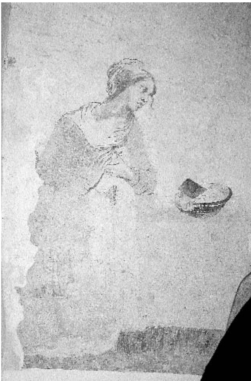
19. Kapela sv. Petra v Stražišču pri Kranju: Oznanjenje, Marija , neznani slikar, po letu 1645