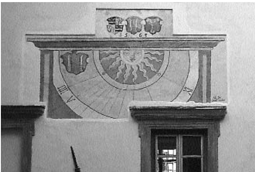
9. Radovljjska graščina: sončna ura, neznani slikar, 1565

lastrih. Nad preklado so naslikani trije grbi 14 donatorjev oziroma lastnikov graščine: levo grb Keuenhüllerjev, v sredi Dietrichsteinov, ki so bili v tem času lastniki graščine in desno grb koroške rodbine Harrach, s katero so bili Dietrichsteini verjetno v svaštvu. Ura je datirana pod grbi z letnico 1565. Nekoliko povečan grb donatorjev Dietrichsteinov se ponovi ob soncu, tik pod preklado. Zgornji del freske je bil dobro ohranjen, na spodnjem delu pa so bile barve skoraj popolnoma izprane, zato je bila poslikava pod preklado skoraj v celoti barvno rekonstruirana. 15 Freska je pomembnejša zaradi svoje dokumentarne kot likovne vrednosti, ker dopolnjuje naše vedenje o zgodovini radovljjske graščine.