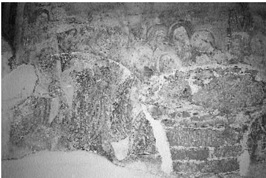
6. Ž. c. sv. Mihaela na Dovjem: Križanje , Veronikin prt in Objokovanje , koroški slikar, sredina 15. stoletja

daj vidna v celoti. Križanje (Höfler 1996, 98–99) dopolnjujejo prizori, prej skriti pod obokom (sl. 6). Levo je upodobljen prizor z Veronikinim prtom. Skupino sestavljajo štiri figure. Veronika stoji tik ob slikovitem okviru, ki je nedvomno nastal sočasno s fresko. V rokah drži prt s Kristusovo podobo. Ob njej je frontalno upodobljena ženska figura z ogrinjalom, ki se pojavlja tudi pri drugih ženskih likih. Pred prtom kleči starejši, belolas moški, ki upira prst v podobo, spremlja pa ga stoječa ženska figura, ki gledalcem obrača hrbet. Osrednji del spodnje polovice freske zavzema prizor žalujočih žena okoli Marije, žal pa je glavnino prizora uničila peta oboka. V skupino je vključen tudi Janez, z desne pa prizor zaključuje skoraj v celoti ohranjena podoba Marije Magdalene, ki objema križ. Desna polovica spodnjega dela fresk in fragment pod peto oboka je slabše ohranjen. Na desni je v višini Objokovanja slabo viden prizor s skupino vojščakov, ki kockajo za plašč, pod peto oboka pa domnevno skupina Židov. Celotna kompozicija, pripisana neznanemu koroškemu slikarju iz srede 15. stoletja (Höfler 1996, 98–99), je nedvomno najbolj monumentalna freska na zunanjsčini na Gorenjskem. Ker je bila od 18. stoletja pod streho, so jo poškodovali le posegi pri preboju