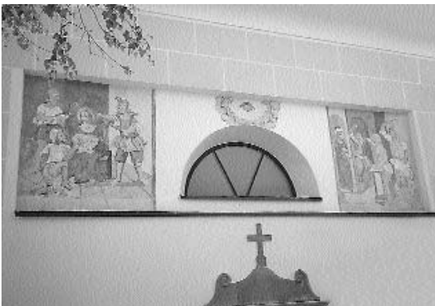
13. Ž. c. sv. Tomaža v Krašnji: Pasijon , neznani slikar, 17. stoletje

ti. Prizor na levi prikazuje Jezusovo kronanje, na desni pa bičanje. Upodobitvi sta zanimivi zlasti zaradi slikovitih noš vojščakov, manj pa zaradi kvalitete slikarja, ki izhaja iz srednjeveške tradicije in skoraj ne presega obrtniško delavniške kvalitete. Krištof na južni steni ladje je v skoraj v celoti preslikan, 18 ker je bil slabo ohranjen (sl. 11). Na osnovi kompozicije in oblikovanja obrazov pa ga lahko datiramo prej na začetek 18. kot v 17. stoletje. Morda ga je naslikal celo isti avtor, ki je preslikal Krištofa pri sv. Ožbaltu.