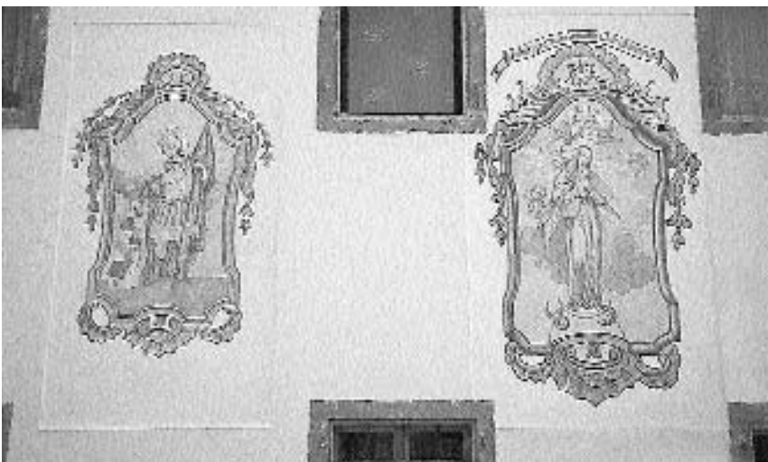
21. Poštna postaja na Zg. Otoku: Sv. Florjan in Brezmadežna , neznani slikar, 18. stol.