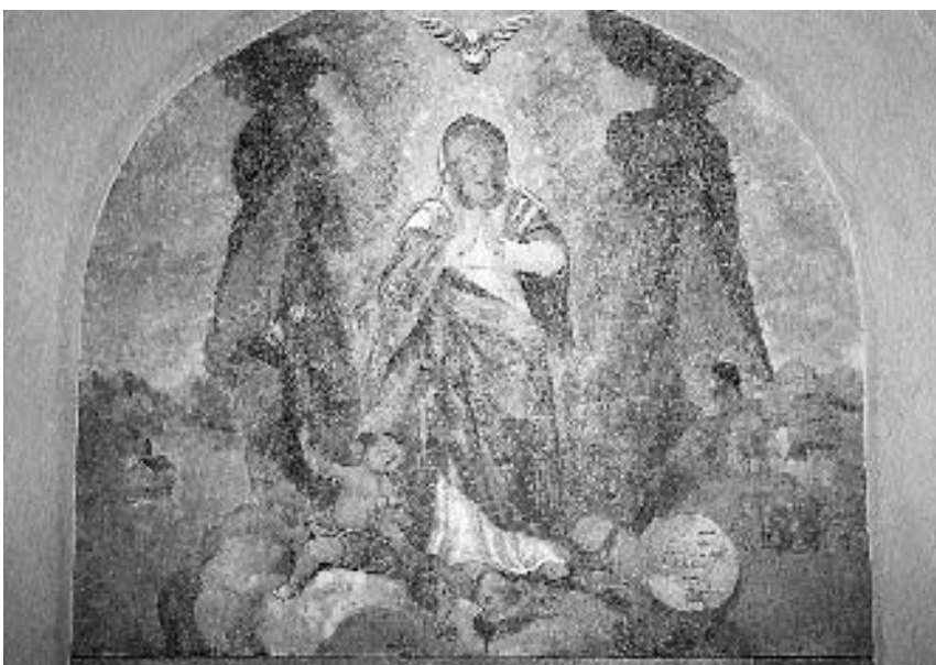
22. Ž. c. sv. Florjana v Lahovčah: Brezmadežna , Layerjev krog, 185?