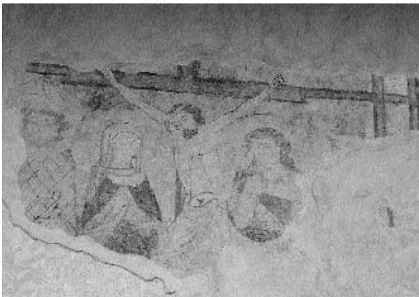
1. P. c. sv. Ožbalta na Zg. Jezerskem: Križanje , sredina 14. stoletja