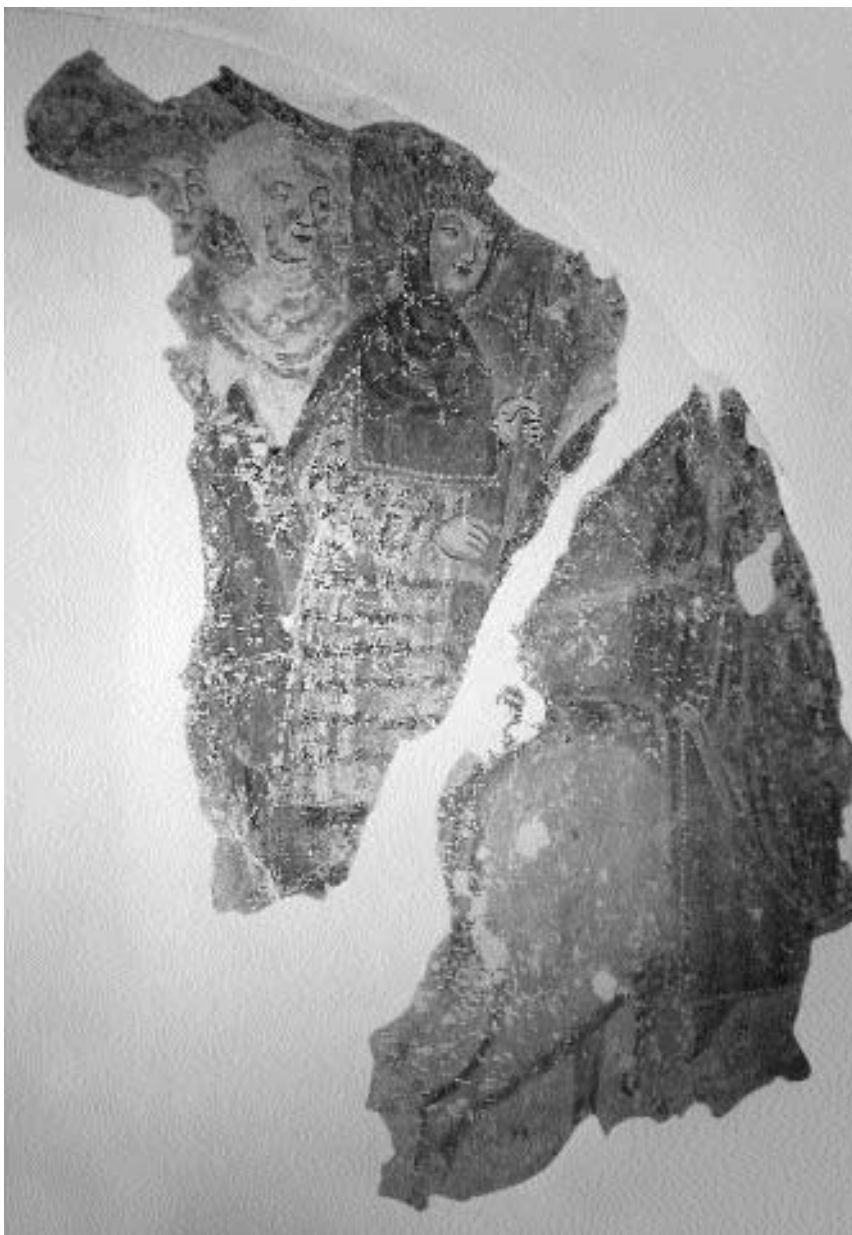
7. P. c. sv. Janeza Krstnika na Spodnjem Otoku: Pohod svetih treh kraljev , Jernej iz Loke, 1525 do 1530