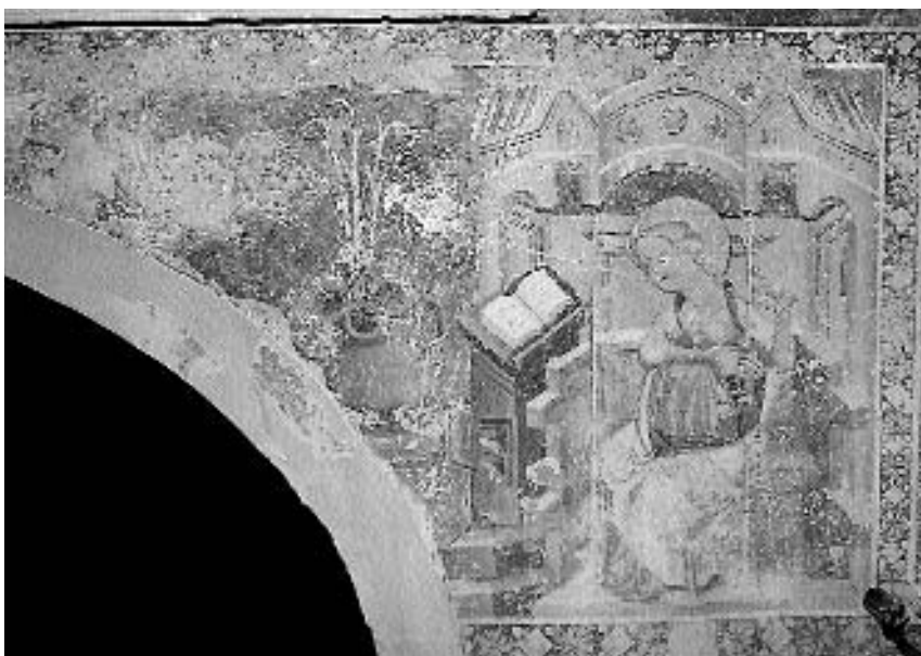
2. P. c. sv. Radegunde na Bregu pri Žirovnici: Oznanjenje , mojster Žiganje vasi, drugo desetletje 15. stoletja