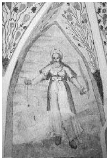
16. Ž. c. sv. Katarine v Lomu: sv. Marjeta , slikarska delavnica prezbiterijskega v Crngrobu, druga četrtina 17. stoletja