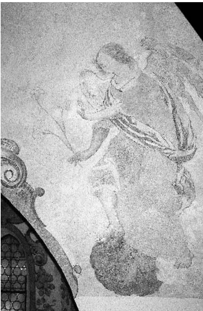
20. Kapela sv. Petra v Stražišču pri Kranju: Oznanjenje, angel , neznani slikar, po letu 1645