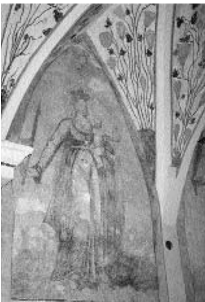
15. Ž. c. sv. Katarine v Lomu: Rožnovenska Marija , slikarska delavnica prezbiterijskega v Crngrobu, druga četrtina 17. stoletja