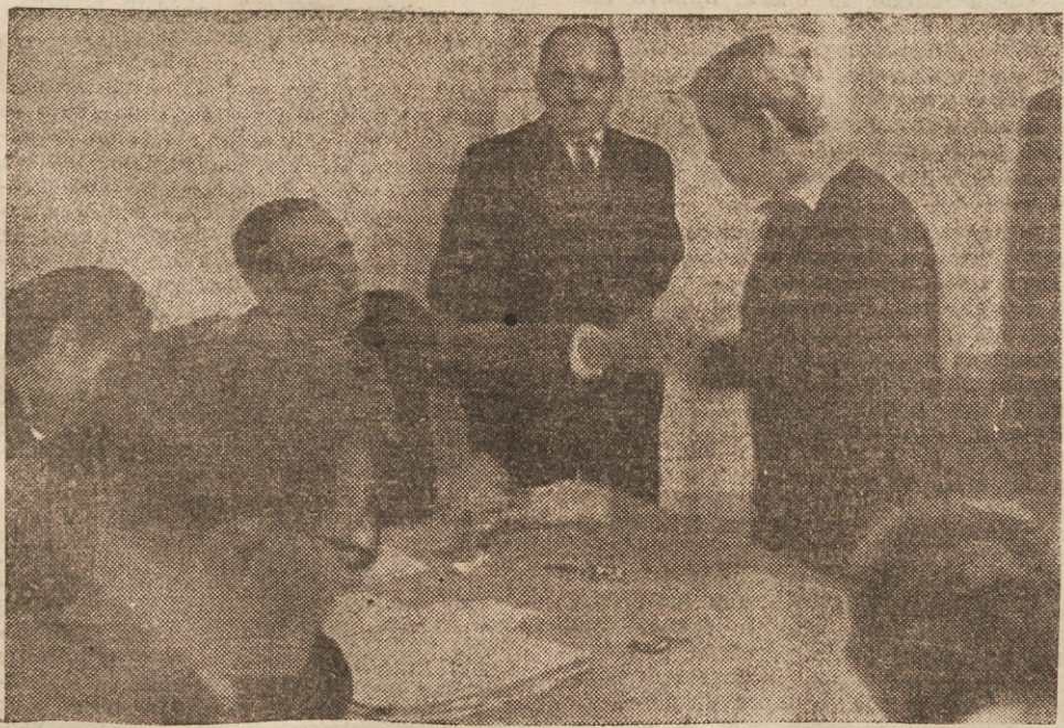
13-letni mladinec iz Trbovelj si je v borbi priporil volilno pravico

Hrušica, ta mala gorenjska vasica, je 11. novembra odločila svojo usodo. Volila je republiko, na čelu z maršalom Titom.