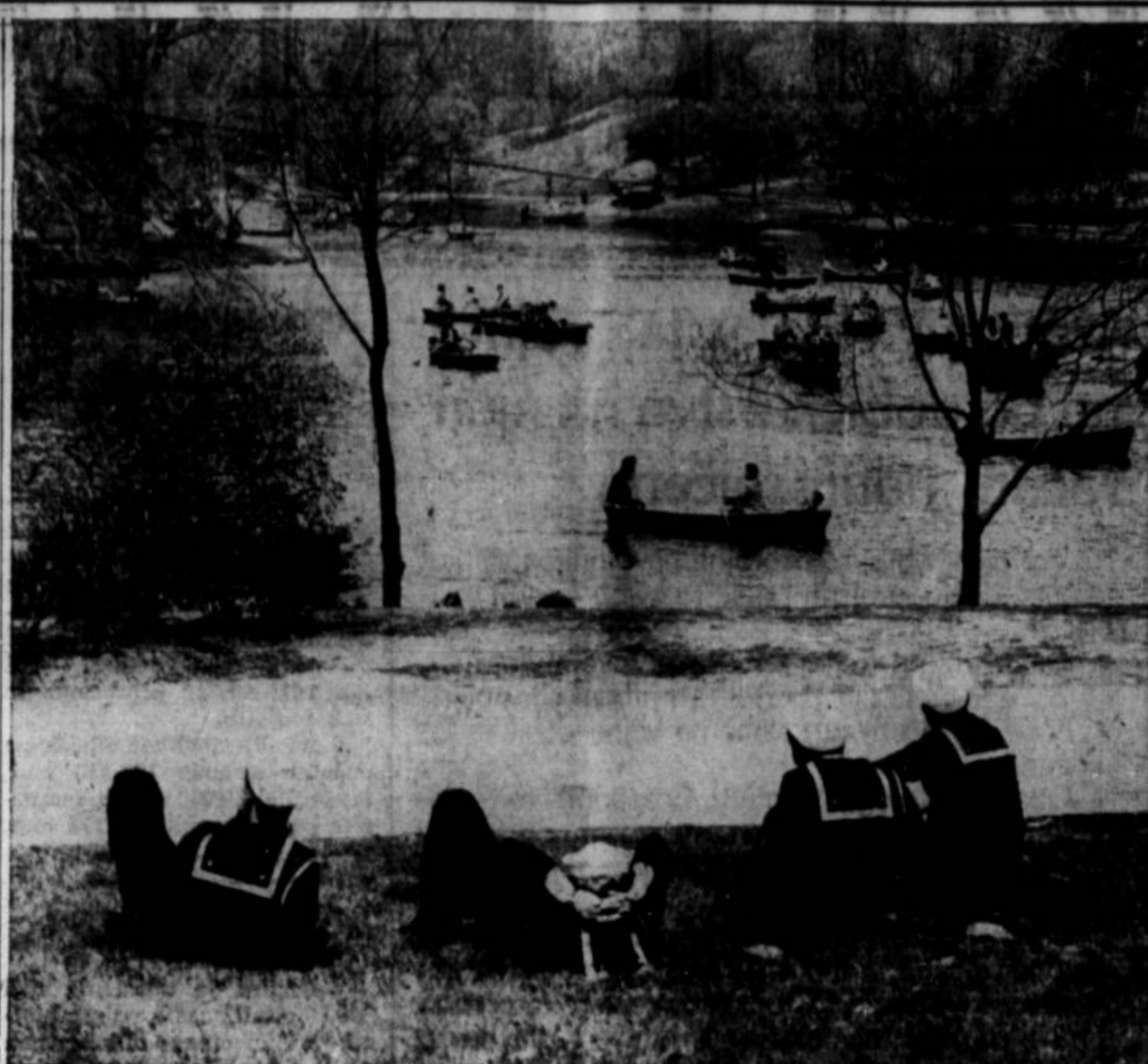
MORNARJI SO VČASI RADI TUDI NA SUHEM. Gornja slika je iz New Yorka, kjer mornarji na dopustu počivajo na obrežju in gledajo civiliste, ki se zabavajo z vojnjo v čolnih.

Ko je Churchill dejal, da si ignorančna ljudstva predstavljajo