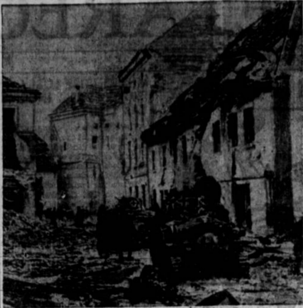
GORNJE JE SLIKA IZ ITALIJANSKEGA MESTA, ki so ga napadli (italijanski) partizani in ga imeli deset dni zasedenega. Predno so jih mogle nemške čete izgnati iz njega.

Od kar smo v vojni, pa do začetak maja, znašajo izgube obojestrane sile Zed. držav na vseh bojiščih 201,454 mož. Izmed teh je bilo 46,518 ubitih, 76,391 ranjenih, 42,749 pogrešanih in 35,796 ujetih.