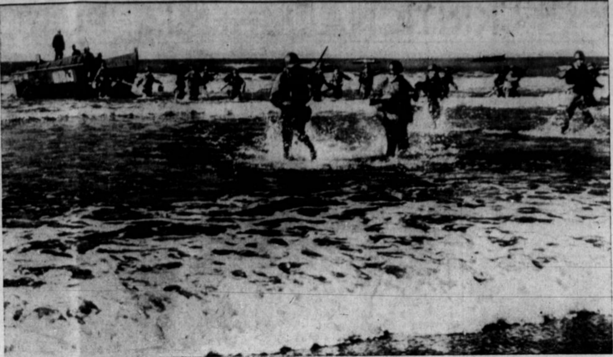
AMERIŠKE IN ANGLEŠKE CETE V ANGLIJI se že mnogo mesecev vežbajo za vpad na kontinent. Gornje je slika ameriške pehote, ki bo v invaziji imela v boju z nemškimi "nepremagljivimi" ogromno vlogo.

Neznanje je delavcev najhujši sovražnik.