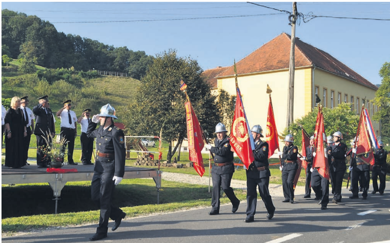
Gasilska zveza Majšperk pod gasilskim praporom povezuje gasilska društva Majšperk, Majšperk-Breg, Ptujška Gora, Medvedce in Stoperce. V 20 letih so uspešno obnovili vozni park in gasilske domove, opremo, ob tem so ves čas skrbeli tudi za izobraženost in usposobljenost gasilcev in gasilk.

In ravno nesebičnost in srčnost gasilcev so izpostavili mladi Stoperčani iz tamkajšnje podružnične šole. Dodali so še, da so gasilci pogumni, vztrajni, vzdržljivi, predani, da imajo veliko srce ter da so vedno pripravljene pomagati drugim. In te lastnosti gasilci uspešno privzajajo tudi mladim, ne samo v Stopercah, temveč na celo-