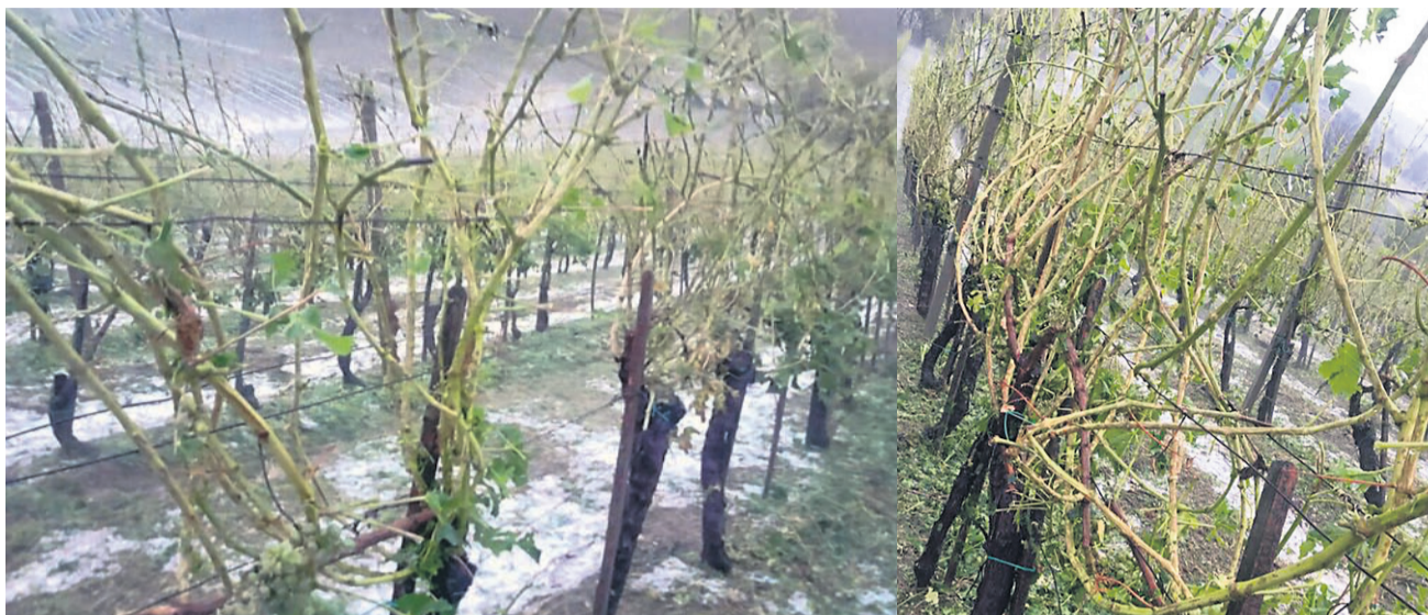
Pogled na opustošen vinograd tik pred trgatvijo

Neurje je na Štajerskem najprej zajelo območje občine Šentilj, kjer je voda zalila okoli 30 stanovanjskih hiš in poslovnih objektov, gasilci so sanirali tudi en plaz. Iz Šentilja se je vremenska ujma pomaknila na območje občine Pesnica. Tam je veter poškodoval strehe več stanovanjskih hiš in podrl nekaj dreves. Močan dež je zajel celotno območje Maribora, kjer so vodo črpali iz več stanovanjskih in poslovnih prostorov. Pri odpravi posledic neurja so pomagali gasilci prostovoljnih gasilskih društev in poklicne gasilske enote Maribor.