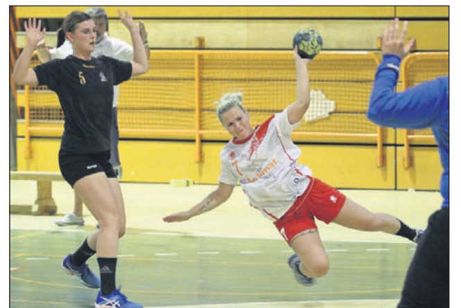
Ptujške igralko so se odlično upirale državnim prvakinjam.