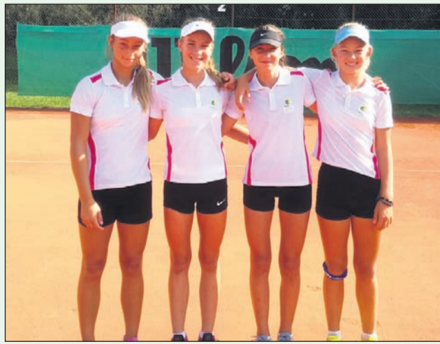
Ekipa deklet TK Terme Ptuj U-14, ki se je uvrstila na zaključni turnir najboljših četverice letošnjega ligaškega tekmovanja.