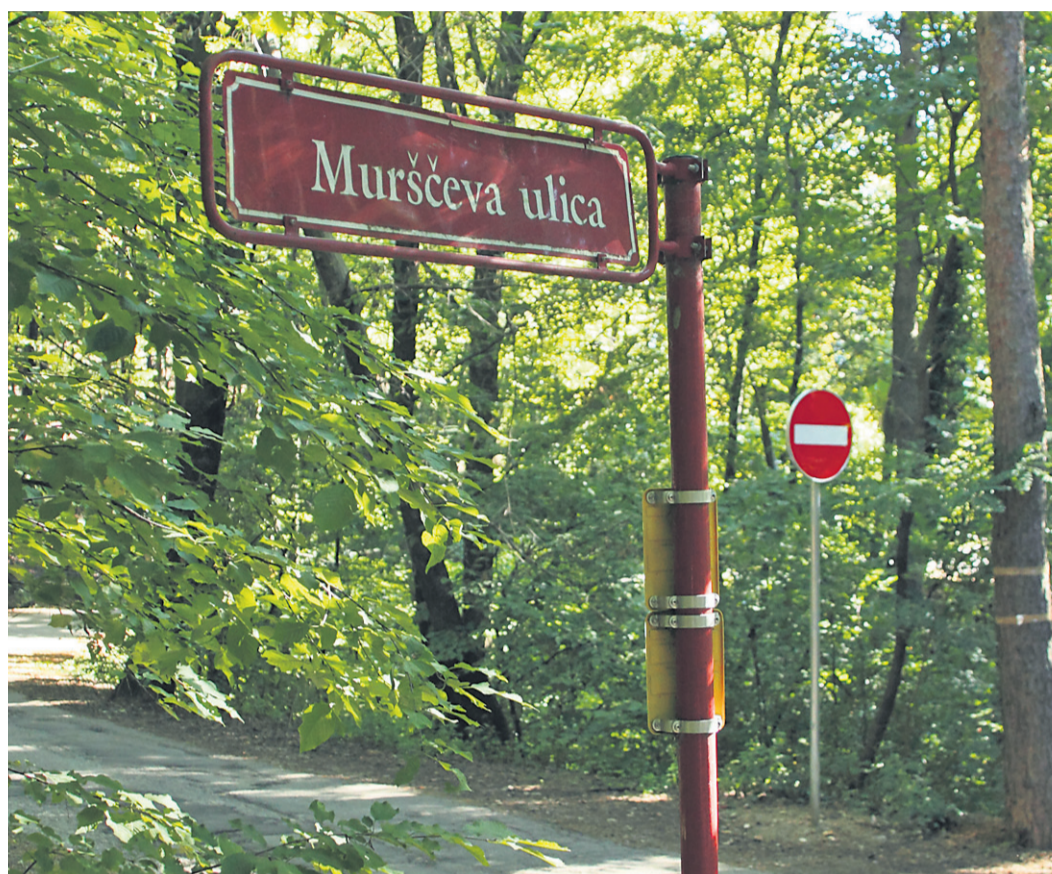
Enosmerna, a le za kratek čas. V roku meseca dni bo ponovno možno peljati v obe smeri.

»Sprememba je začasna, da vidimo, kaj smo z njo pridobili in kaj izgubili,« je dejala predsednica ČS Ljudski vrt. A to še zdaleč ni bil zadovoljiv argument za prisotne krajanke, ki so prišli jasno in glasno izraziti nestrinjanje z novim prometnim režimom. Zagovornikov tega namreč tokrat na seji ni bilo, bojda je tako odločila predsednica sveta ČS Ljudski vrt, kar pa je presenetilo preostale prisotne. »Pričakovali smo, da bodo tu zagovorniki te spremembe, tisti, ki sploh ne živijo na tej ulici. Na podlagi česa ste se sploh zavzeli za to rešitev? Krajan, ki živimo tukaj, sploh nismo