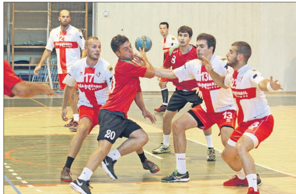
Rokometaši Drave so proti gostom iz Hrvaške uigravali različne postavitve v obrambi ter napadalne različice.