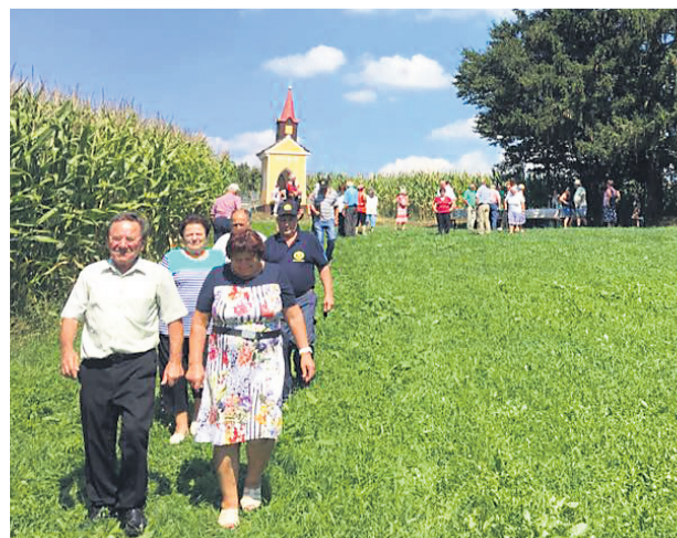
Utrinek s pohoda po zgodovinskih točkah.