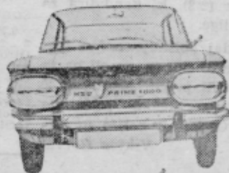
NSU 1000 C

Za žrebanje pridejo v poštev vsi lastniki vezanih dinarskih in deviznih sredstev, ki bodo do 30. junija 1969 vezali svoje vloge od 1000 din navzgor na več kot eno leto.