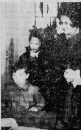
Vpis v prvi razred

mehanizacije in vsekakor ne nazadnje tudi previsoke davčne obremenitve. Niso redki primeri, ko se lahko na lastne oči prepriča o bedi in revščini posameznih kmečkih gospodarstev, na katerih sta ostala zgarana »virt in gospodinja«, medtem