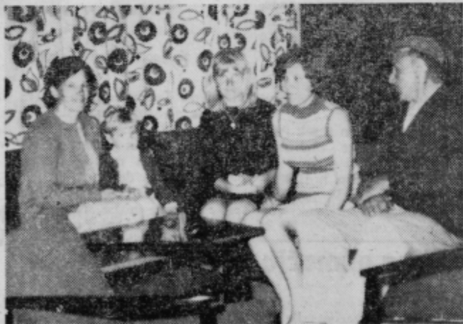
Naši obiskovalci med razstavljenim pohištvom: »Kako lepo bi bilo, če bi imeli vse to doma v stanovanju.«

lepa reklama za proizvajalca ter možnost za obiskovalce, da lahko razstavljeno blago tudi kupijo. Za enkrat so samo gledali ter ocenjevali. Niso pa še se odločili, če bodo kaj tudi kupili. Če ne tokrat pa drugič. Potrebe nas vedno prisili-