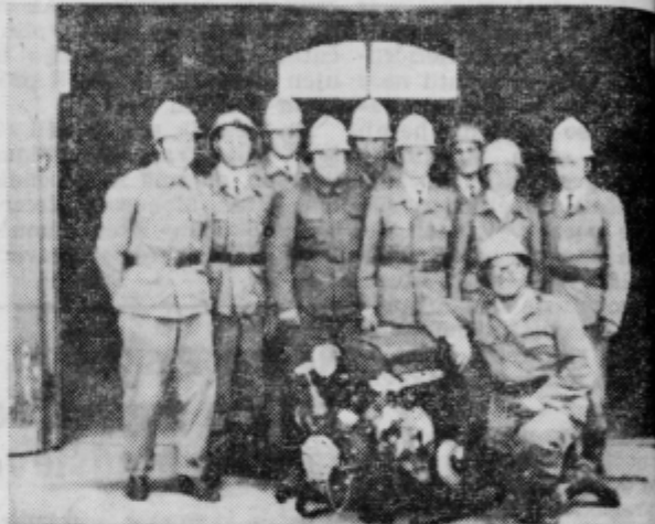
Gasilci iz Medvedce ob prevzemu brizgalne