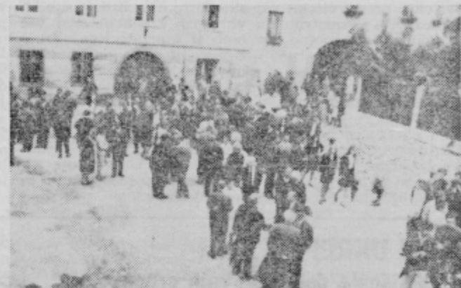
Srečanje nekdanjih profesorjev in dijakov na Vrazovem trgu pred odkritjem plošče na prvem gimnazijskem posloplju.

nem paviljonu Dušana Kvedra je razlagal razstavižena dela Albin Lugarič, profesor gimnazije.