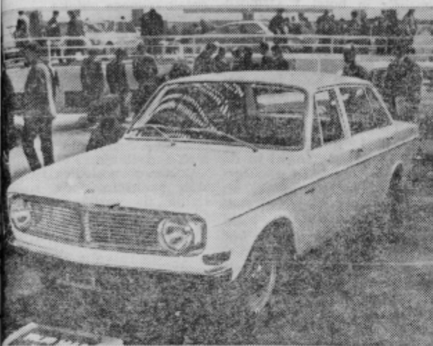
Tekst in foto: Jože Galun

Moje mnenje: za 5.000.000 starih dinarjev preglasen motor, premalo udobja na slabih cestah in preveč občutljiv na bočni ve- ter.