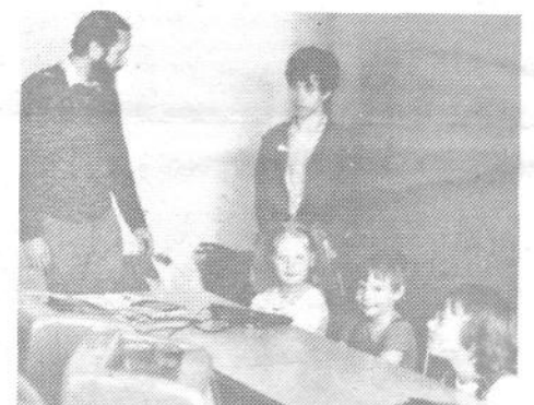
POSKUSNA SKUPINA CICIBANOV PRED RAČUNALNIKI – Kar se Janežek nauči, Janež zna – velja tudi za znanje in poznavanje računalskih.

Skupaj z vodstvom naših združenih vrtcev so izbrali skupino šestletnikov iz starega trnovskega vrta. Zanje so pripravili poseben program, ki ga spoznavajo dvakrat tedensko po dve šolski uri. Odziv otrok je še boljši kot so pričakovali in z nekaj več individualnega dela so se »računalske šole« lotili vsi otroci. V skupini jih je 18. Sedanjí odziv in program sta pokazala, da bi lahko za te otroke pripravili še en program, seveda nadaljevanje sedanjega. Seveda je pri tem vprašanje denarja, saj stane organizacija sedanjega tečaja 140.000 dinarjev. Polovico je primaknil vrtec, polovico stroškov pa kridravec, polovico stroškov pa krije Inštitut Jožefa Štefana. Za otroke oziroma njihove starše je tečaj brezplačen.