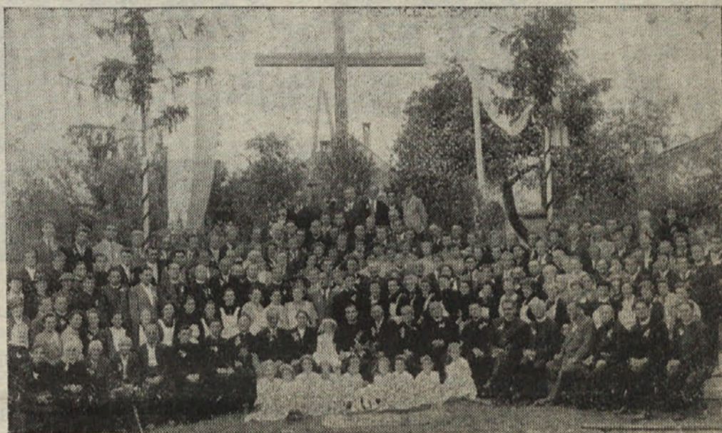
Novomašni svatje v Šmarjeti

Da je vrsta govornikov v šaljivi in resni besedi želela novomašniku obilo sreče in božjega blagoslova na življenjski poti, pa se razume. Tudi deset belo oblečenih deklic se je oglasilo z ljubko pesmijo; že dopoldne so pokazale, da znajo korajžno nastopiti z