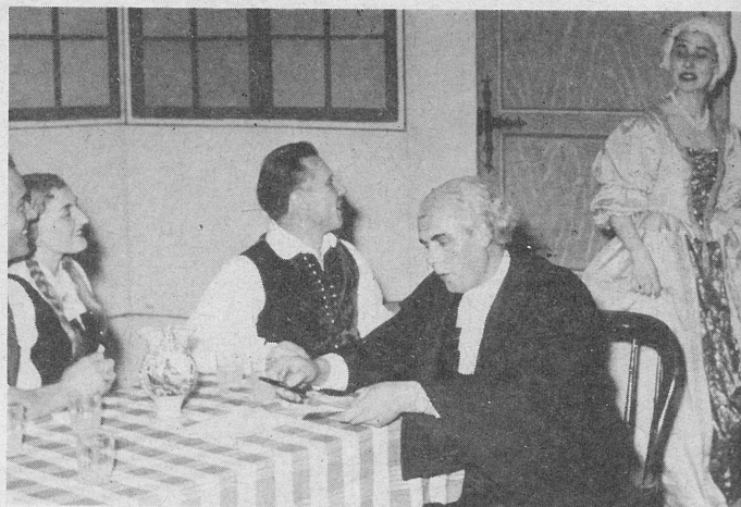
Že leta 1957 je S.D.M. postavilo na oder prvo slovensko igro v Melbournu: "Županova Micka".

V glavnem so nas zbudle izjave, da so Slovenci, ki so prišli v Avstralijo bili "socialna skupina brez kulture . . .", da je "Avstralska slovenska skupnost sestavljena domala v celoti iz ekonomske emigracije . . ." od Slovencev, ki so prišli v Avstralijo "s trebuhom za kruhom" . . ., da jih je po prihodu v Avstralijo "dušila in spreobrnila povojna politična emigracija" . . ., da so pričeli ustanavljati svoja društva šele ko so se "ekonomsko osamosvojili" ter, da se šele od leta 1972 njihova društva spreminjajo v "društva z močnim nacionalnim obeležjem".