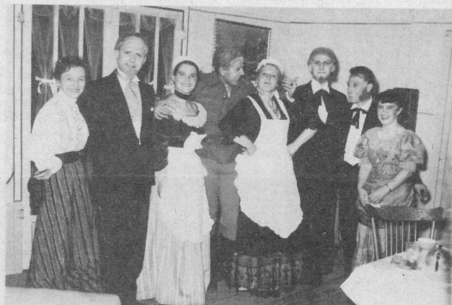
Z marsikatero veselo urico je naša gledališka skupina lajšala našo skupno usodo in nas spominjala na dom.

Igra "Razvalina življenja" (na sliki spodaj) se vrsti na repertoarju skupaj z "Divjim lovcom", "Desetim bratom", "Svojejavčkom" itd. vse do leta 1972