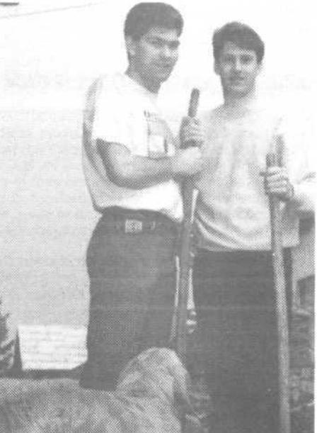
Tokrat sta očistila stopnice. Slikal sem ju pri delu skupaj z našim psom Majem, ki je njun prijatelj.