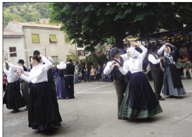
Sakalovska folklor se je predstavila s porabskimi in goričkimi plesi

Že od vsega začetka pomladi se vas pripravlja na postavljanje mlaja sredi vaškega trga, kar je verjetno največji mlaj izmed vseh: v središču dogajanja je ponosni petnajstmetrski smrekov steber,