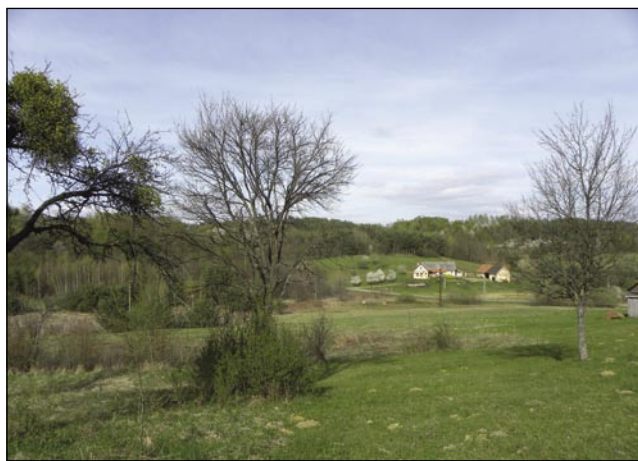
Del porabske pokrajine v Andovcih, kjer bi na travniških sadovnjakih lahko zorele sočne kanadke, jonatanke ...

politična floskula, ampak življenjska nuja; in ravno zato so tudi v Sloveniji, v Pomurju in Porabju potrebna prizadeva-