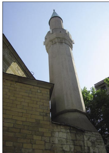
Muslimanom je v Beogradi ostala samo edna džamija

štiristau lejtami srbsko rabuko Törki dojpoklačili, pa za štraf čonte od največšoga srbskoga svetnika Save tazažgali. Na etom mesti so v preminaučom stoletji zozidali velko-velko pravoslavno cerkev svetoga Save, štera je eške gnes nej končana.