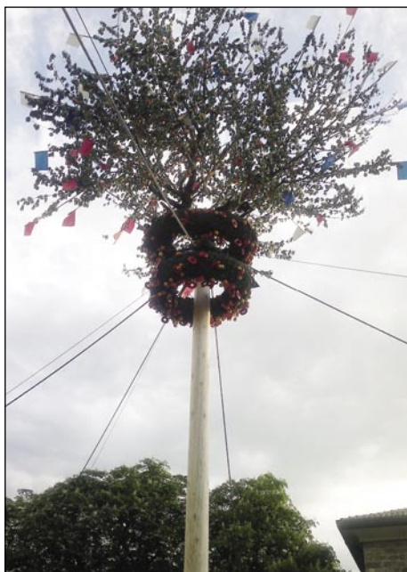
Dolinski mlaj je iz smrekovega stebra, na njem je krošnja domače češnje

Folklorna skupina ZSM Sakalovci je 7. in 8. maja gostovala pri Slovencih v Italiji, v Dolini pri Trstu. Tamkajšnji Mešani pevski zbor Valentin Vodnik je lani gostoval v Porabju na vabilo Zveze Slovencev na Madžarskem, zato nas je letos povabil na njihov najbolj značilni tradicionalni program, na festival Majenca. Majenco, praznik pomladi in dolinske mladine, organizirajo vsako leto na začetku maja. Vabilo smo dobili že nekaj mesecev prej in smo zelo, zelo čakali ta dan. Odpravili smo se že ob 6.00