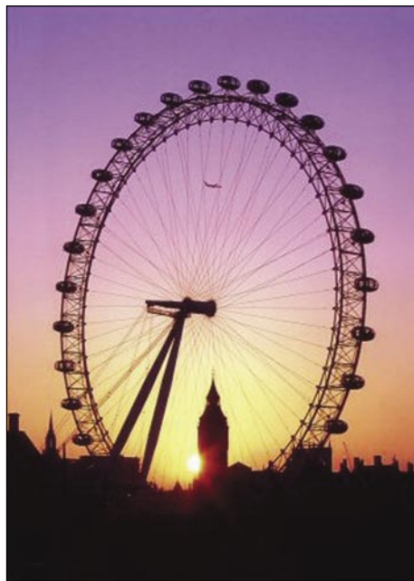
Značilnost angleškega glavnega mesta: London eye

la smo se odpravili na dolgo pot z avtobusom, ki je bil udoben. Prvo noč smo spali