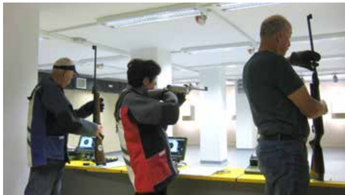
Sodobno opremljeno strelišče z elektronskimi tarčami

Tanja Bricelj