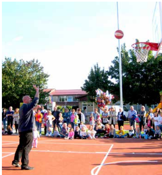
Namesto s tem, da bi prerezal trak, je župan igrišče odprl s prvim metom na koš – in gladko zadel.

Za izjavo smo prosili tudi glasbenega gosta, in Nipke je vsem, ki se bodo igrali na tem igrišču, zaželel naj se igrajo čim bolj povezano, naj se imajo radi in naj delijo to igrišče s svojimi prijatelji. Naj ga čuvajo, da bo čim dalj ostalo tako lepo, kot je zdaj. Pa ... da ga lahko kdaj povabijo na kakšno košarko.