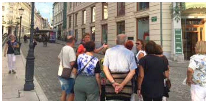
Pogled na današnjo Miklošičevo ulico s Prešernovega trga. Oboje je nastalo v času po potresu, na Hribarjevo pobudo. Nasploh je bil prav Hribar zaslužen, da je Ljubljana na prelomu stoletja dobila novodobn(ejš)i videz.

Po naravi je bil zelo napreden, liberalec, obenem pa tudi velik domoljub, zato so ga mnogi označevali za pravega nacionalista. Ogromno je naredil za krepitev slovenstva in za zavedanje v monarhiji o tem, kje sploh je Ljubljana. V tem duhu je znal izkoristiti celo znani ljubljanski potres, ki je leta 1895 zelo prizadel mesto. Hribar se je najprej »potrudil«, da so za novico izvedeli po vseh krajih monarhije, s tem pa je dal širnemu občestvu vedeti, da Ljubljana potrebuje arhitekta, gradbenike, delavce in drugo delovno silo, ki bo spravila porušeno mesto spet na noge. In ga tudi je.