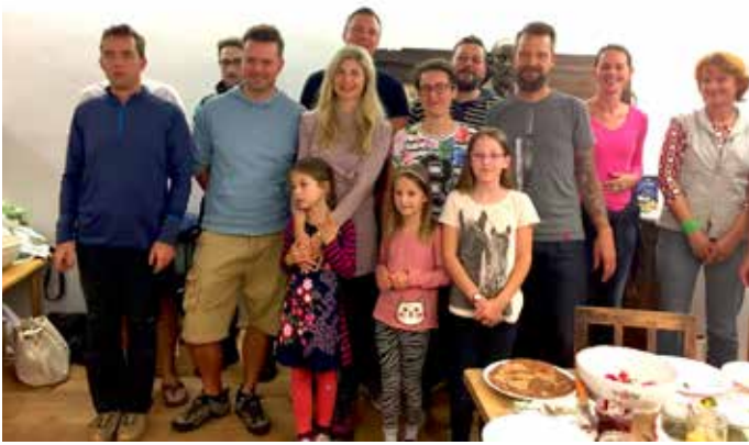
Zadovoljni udeleženci septembrske kulinarčne delavnice