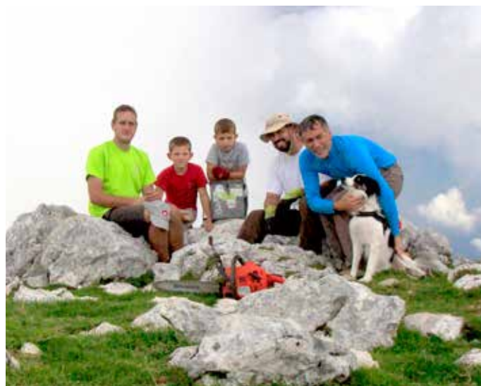
Takole so pozirali člani »žagarske« ekipe na vrhu Kalškega grebena

Miha Pavšek, markacijski odsek PD Onger