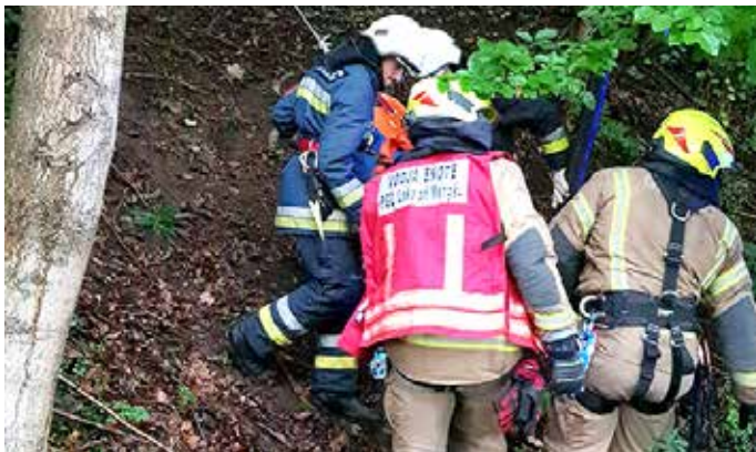
Prikaz primera reševanja poškodovanih pohodnikov na Ongru

Naravnih nesreč ne moremo napovedati in predvideti, z dobro usposobljenostjo, znanjem in vajo pa se lahko nanje vsaj delno pripravimo. Člani gasilskega društva Trzin se tega dobro zavedajo, zato so 22. septembra pripravili medobčinsko gasilsko vajo za primer potresa. Udeležilo se je je okoli 150 članov iz desetih gasilskih društev; poleg domačega, trzinskega društva še gasilci iz Črnuč, iz petih društev v občini Domžale in treh v občini Mengeš in ekipa reševalcev nujne medicinske pomoči kamniškega zdravstvenega doma.