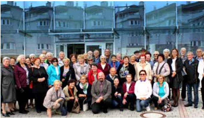
Tradicionalna »gasilska« fotografija udeležencev srečanja – za spomin

Turistično društvo Kanja je z lepo razglednico Trzina povabilo rojake iz bližnje in daljne okolice in seveda tudi domačine na srečanje, ki ga organiziramo v okviru tedna evropske kulturne dediščine vsaki dve leti. Letošnje geslo srečanja je bilo Kjer preteklost sreča prihodnost.