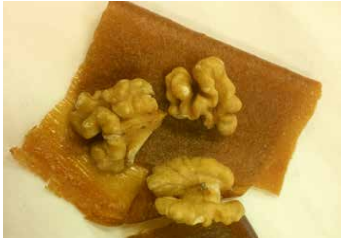
Jabolko in glog, to sta lepi in zdravi par!

Avtohtonim in tradicionalnim sortam pravimo tudi stare sorte jabolk, starost sorte pa nima neposredne zveze z njihovo odpornostjo. V zadnjem času nastajajo pri nas in prihajajo k nam mnoge nove sorte in med njimi tudi odporne selekcije, kakršna je na primer topaz.