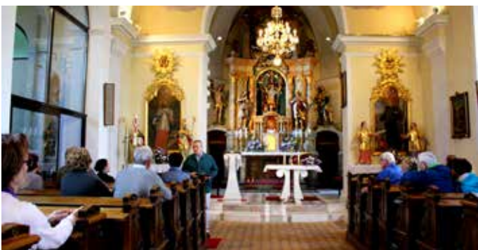
Prva skupina si je pod vodstvom profesorja Dolenca ogledala cerkev svetega Florjana.