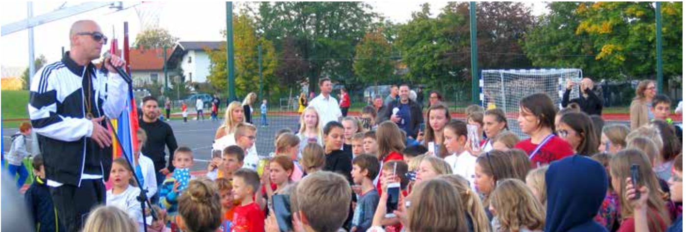
Nipke je navdušil tako s svojim nastopom kot s svojo poslanico, ki jo je namenil zlasti otrokom, ki se bodo igrali na tem igrišču. Ob tem je igrišče pohvalil s primerjavo, da v Ljubljani, od koder je on, ni tako urejenega igrišča.