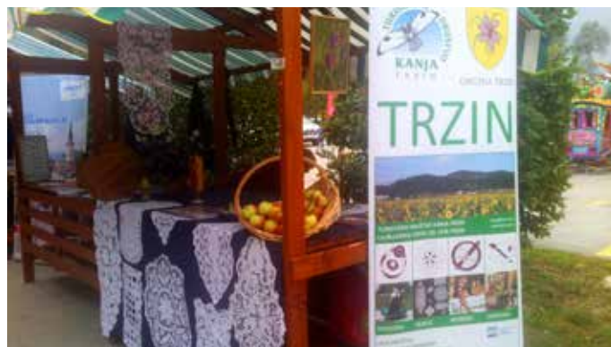
Lepo urejena stojnica TD Kanja na Mihaelovem sejmu