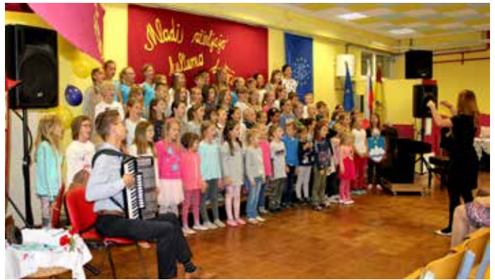
V šoli so udeležencem srečanja pripravili zares pester in imeniten program.