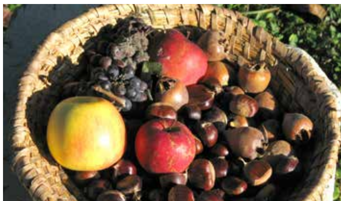
V tem peharju je kar nekaj meric kostanja; kako dober bo, ko se nam bo ob koncu pečenja ob zarezih še »nasmehnil« in ga bo treba pred zaužitjem le še olupiti.

V preglednici ob članku velja posebej opozoriti na podatek o sedmih toplih dneh, zanimiv pa je tudi, da smo zadnjo septembrsko sredo