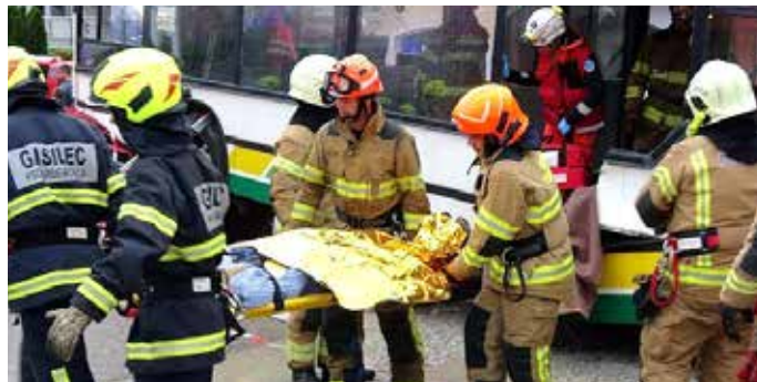
Utrinek iz ene od akcij na septembrski sektorski vaji v Trzinu

dogodkov (prometna nesreča, požari, uhajanje plina, poškodovane in pogrešane osebe), je bila zasnovana tako, da je imelo vsako društvo svojo intervencijo, potekala pa je na območju Ljubljanske ceste, T3 in Ulice za Hribom ter na Ongru. Na vaji se je pokazalo, da so društva različno opremljena, zato so si gasilci po potrebi opremo med sabo izposojali. Postavljen je bil tudi šotor za triažo, tu pa se je pokazalo, da je ob množičnih nesrečah težko oskrbeti vse poškodovane naenkrat.