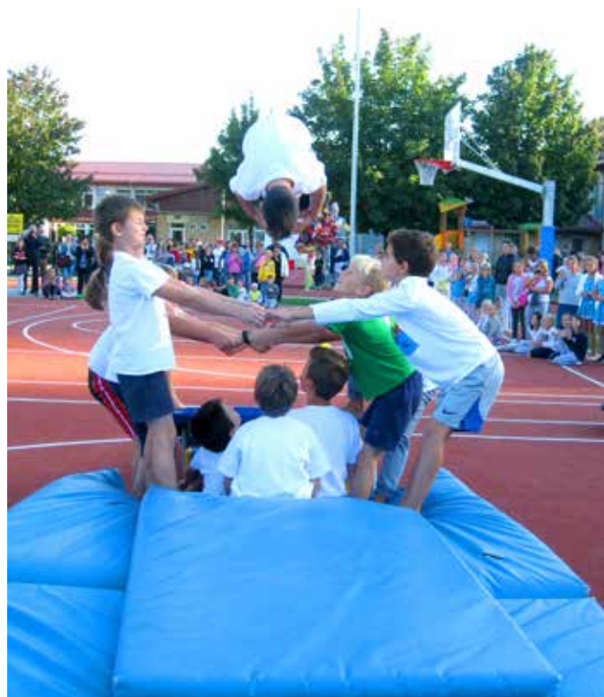
Za pravi mali poskakujoči spektakel so poskrbeli trzinski učenci, člani športnega društva Trzin.

Igrišče pa bo lahko dolgo ostalo lepo le, če bodo njegovi uporabniki upoštevali tudi nekaj prepovedi, med drugim to, da se po tartanu ne smemo voziti s skiroji, rolerji, rolkami, kolesi in kotalkami, saj prav ta prevozna sredstva najbolj uničujejo tartansko podlago. Iz tega razloga je ob progi izdelan »pločnik«, po katerem se je mogoče pripeljati do asfaltiranega dela, torej do nogometnega igrišča, kjer pa je rolanje, kotalkanje ... varno in dovoljeno.