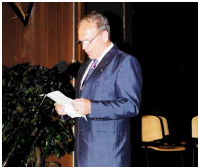
Med govorom na proslavi ob občinskem prazniku, maja leta 2000