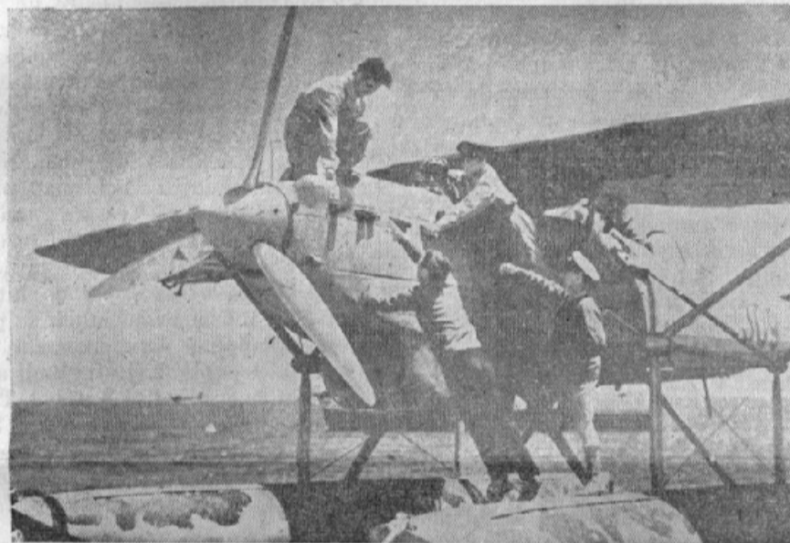
Jugoslovanski letalci nekje na Bližnjem Vzhodu

Japelj je gojil tudi posvetno pesništvo; prevodi iz raznih tujih pisateljev in dve originalni posvetni pesmi so ostali v rokopisu. Istotako