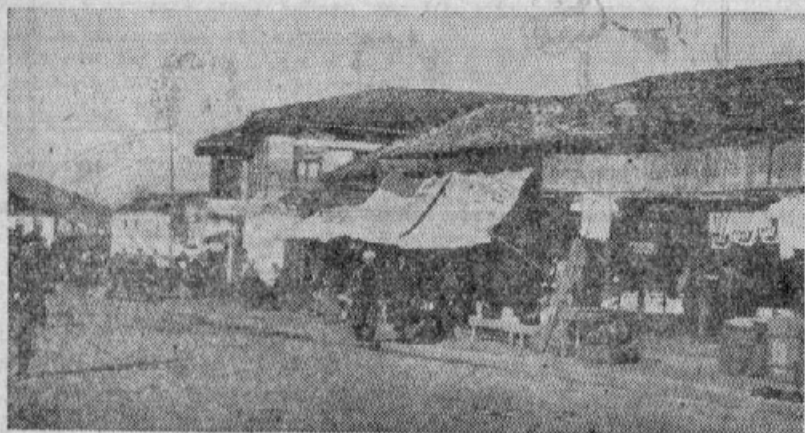
Kosovska Mitrovica, kjer se je te dni prebivalstvo uprlo Nemcem ter je bil grozen pokolj.

streljali mnogo vojakov. Moskova radio postaja javlja, da četniki (komiti) posebno v goratih krajih stalno ogražajo sovražnika. Pri Mit-