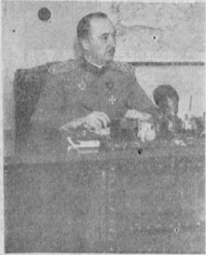
Gen. Dušan Simović, preds. vlade

Vojni kabinet predsednika vlade generala Dušana Simovića, je razen majhnih izprememb isti, kakor je bil formiran v Beogradu dne 27. marca t. l. Na mestu prvega pod-