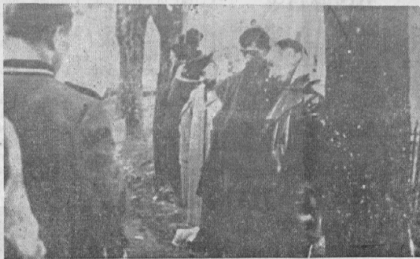
Pri neki vasi obešeni. Nemški vojak, slikan od zadaj, opazuje žrtve.

V Medjimurju žive Hrvati in zato je svet mislil, da tam ukazuje firerček "velike, svobodne in nerazdeljive (toda na mnogo kosov razdeljene)" Hrvaške. Pa ni tako. Vodstvo madžarske vojske je te dni naznanilo v Budimpešti, da je prevzelo upravo Medjimurja v svoje roke in je torej ta kos hrvaške zemlje vzela Madžarska.