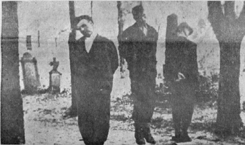
Nemška grozodejstva: Na nekem pokopališču na Hrvaškem obešeni kmetje. Obešenci imajo zvezane noge in roke.

Zato je potrebno, da se naša narodna obrana pozanima tudi za to poglavje in poskrbi za našim, po katerem bi in mogli tudi mi Slovenci kaj storiti v pomoč našim prijateljem v skrajni bedi in stiski.