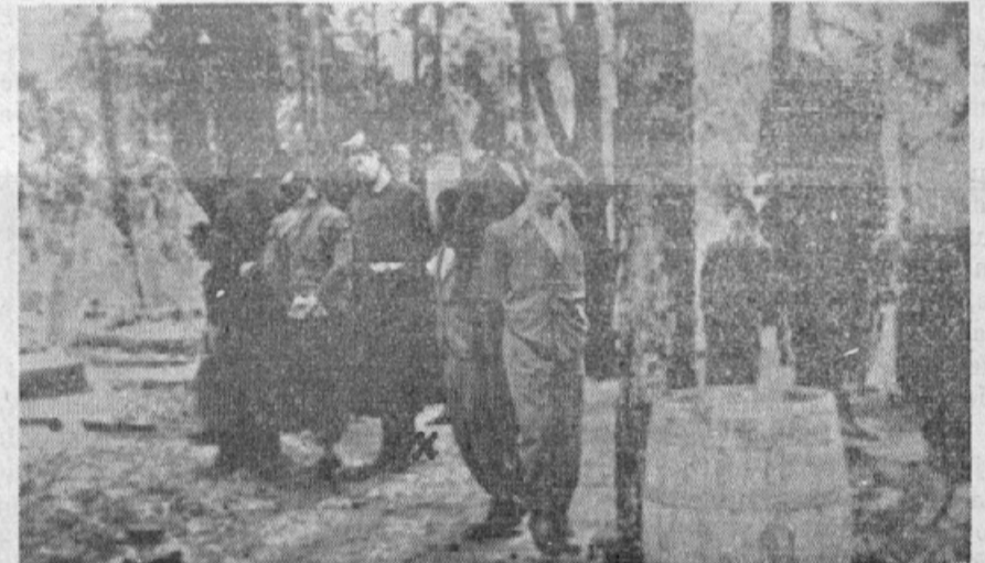
Obešenci v nekem gozdu. Med obešenci je tudi ena ženska (x)

Samostane so že vse zatrli. Redovnikom so ukazali, da morajo izginiti v eni uri in vzeti s seboj samo, kar imajo na sebi. Frančiškanski samostan v Mariboru je sedaj sedež ženske "Gestapo". Prav tako so raz-