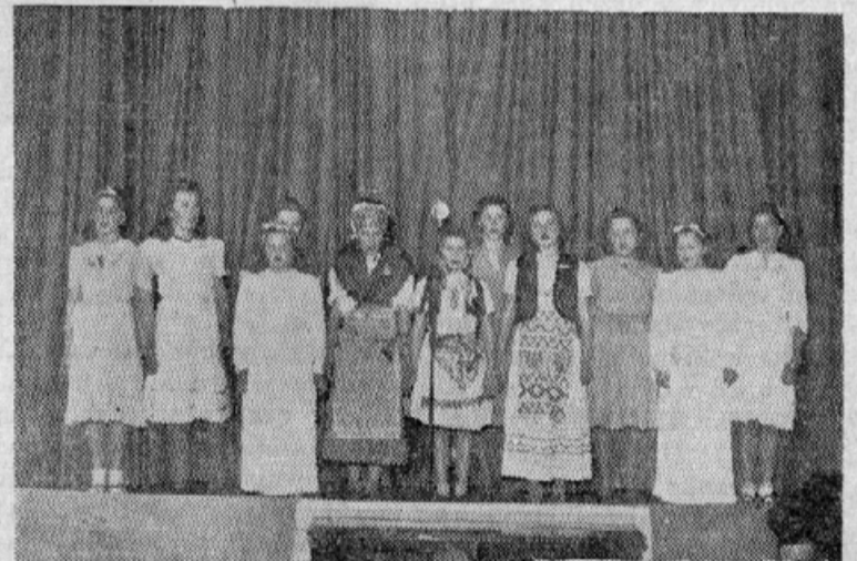
Šolski mladinski zbor v Rosariu

“Jaz vam dajem takšen užitek, vi mi pa kar venomer stopate po nogah!”