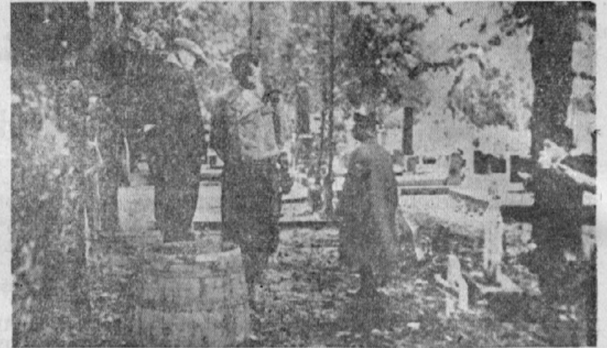
Nemški častnik opazuje obešence. Ob strani se vidi ljudi, morda so njihovi sorodniki, ki objokujejo žrtve.

izgledalo, če bi Pavelić po pravici povedal, da strelja hrvaške rodoljube, ki se nočejo pokoriti totalitarizmu plačancu, mu je zelo prav prišlo, da je Nemčija napadla Rusijo in proglasila "križarsko vojno" proti boljševizmu. Vsi tisti, ki Paveliću niso všeč, bodo odslej "komunisti". Te dni so jih ustrelili prvih deset, ker so baje nahujskali nepoznane ljudi, da so nekega vstaškega policijskega oficirja spravili na drugi svet.