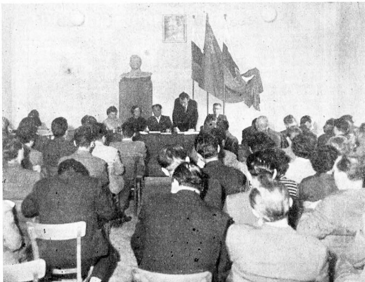
Delegati na konferenci med razpravo

Novemu vodstvu čestitamo in želimo obilo uspeha.