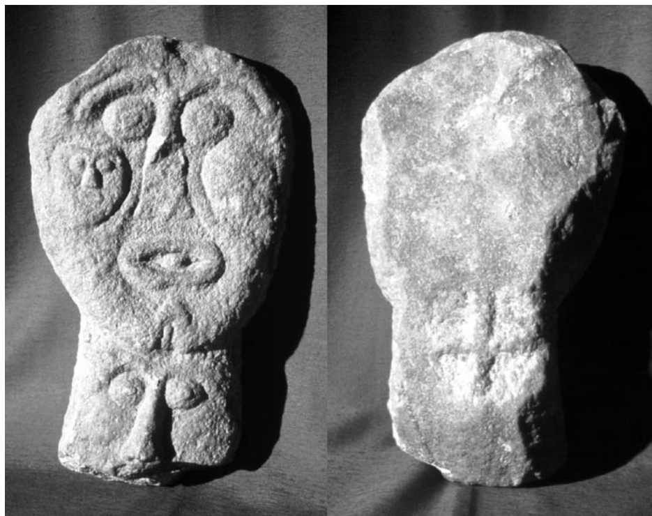
Abb. 4. Dreigesichtiger Götterkopf aus St. Martin am Silberberg, Gemeinde Hüttenberg, Bez. St. Veit a. d. Glan/Št. Vid, Kärnten. Vorderansicht und (nachträglich veränderte) Rückseite; Marmor, slawisch; 7.–9. Jh.?

Slika 4. Triobrazna glava božanstva s Sv. Martina na Silberbergu. Občina Hüttenberg, okraj St. Veit a. d. Glan/Št. Vid, Koroška. Sprednja stran in (drugotno predelana) zadnja stran. Marmor, slovansko, 7–9. st.?