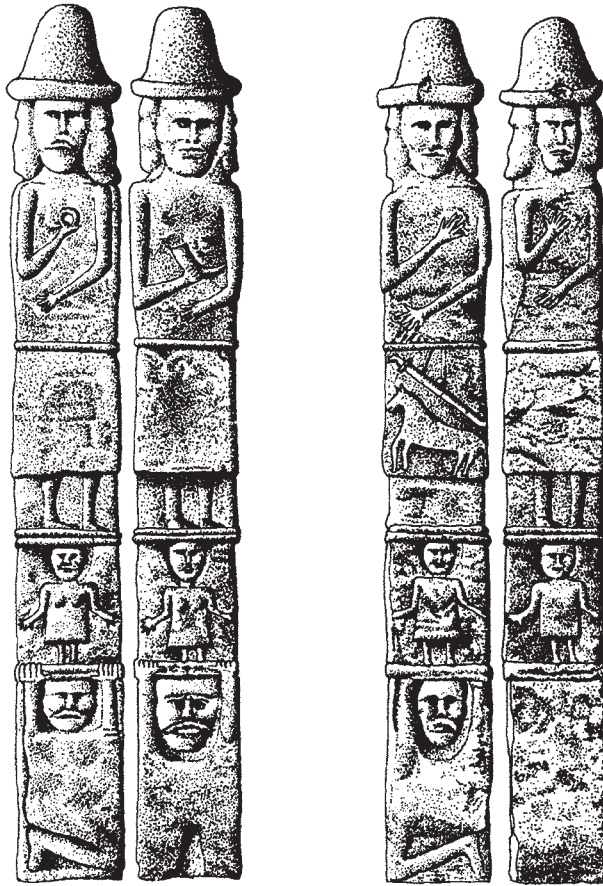
Abb. 1. Vierseitige Götterstele aus dem Zbruc (Wolhynien, Ukraine), Kalkstein, slawisch, 1. Hälfte 10. Jh.? Nach Slupeaceki, Slavonic Pagan Sanctuaries, S. 226.

Eins der wolhynischen Beispiele sei genauer betrachtet, weil es Fragen berührt, die weiter unten zu erörtern sind (Abb. 1) 14 . Die Kalksteinstele, ca. 2,60 m hoch, 0,30 m breit,