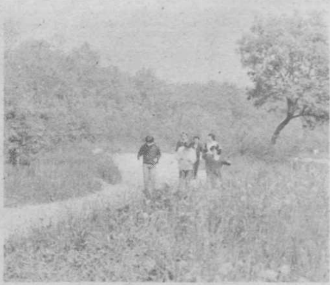
Kot večina drugih, tudi ta ekipa prihaja na kontrolno točko po pravilno izbrani smeri, čeprav je kakšna tudi zašla s prave smeri.