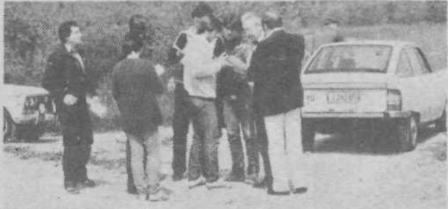
Zmagovalna ekipa na 3. kontrolni točki rešuje nalogo iz določanja smeri s pomočjo kompasa