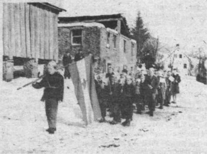
Takšni so bili pionirski pred davnimi leti – proti koncu ali takoj po vojni – ko jih je neznan fotograf posnel med slavnostnim pohodom skozi vas.