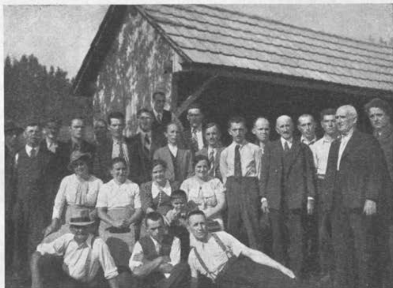
Sestanek čebelarjev pri našem podružničnem čebelnjaku.

Mnogo je bilo truda in mnogo potov, preden smo imeli vse potrebno nabrano. Osrednje čebelarsko društvo nam je naklonilo primerno podporo. Les smo povečini dobili v dar od domačih gozdnih posestnikov, cementno opeko nam je poceni naredil član podružnice. Ogrodje je za primerno ceno stesal in postavil tesar domačin, nekateri