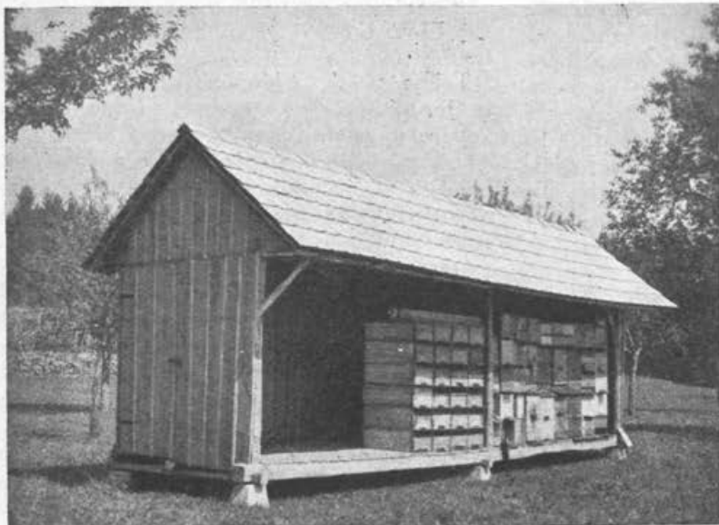
Čebelnjak podružnice Krtina na ajdovem pasišču pri Vodichah.

Prav za prav bi moral biti postavljen naš čebelnjak že lani, ko je krtinska podružnica proslavljala 20 letnico svojegega delovanja. Toda razne neprilike so to namero zavleklo do letošnjega poletja.