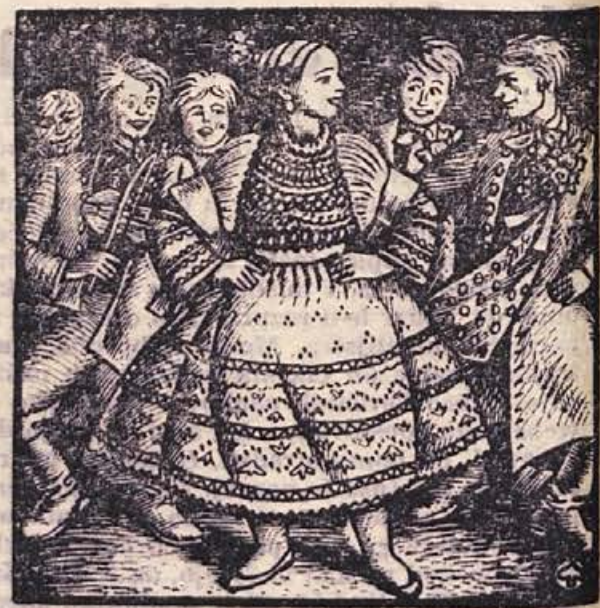
Merčin Nowak-Njehornski: ILUSTRACIJA (iz »LETECE LADJE« in drugih lužniškobosrbskih pravljic; izdala Mladinska knjiga v Ljubljani, 1959)

Po posvetovanju so člani posameznih organizacij razpravljali v komisijah. Tu so skušali prilagoditi svoje črje programe sklepom posvetovanja. —jk