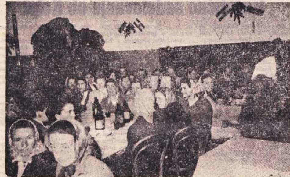
Da je postal 8. marec resnični praznik naših delovnih žena, naj pove tudi ta fotografija, posneta v Drči pri Sentijerneju 17. marca: tudi tu so žene množično in prigrčno lepo počastile mednarodni ženski praznik. Obudile so spomin na minula leta in v prijetni družbi pokramljale o tem in onem, kar doživljajo, delajo in čutijo. Takih srečanj je bilo letos povsod veliko — dokaz, da je iz leta v leto dan žena resnično bolj ljudski praznik

Po sporazumu bo znašala vrednost letošnje trgovinske izmenjave med našo državo in Mongolijo 1,2 milijona dolarjev, kar je znatno več kot v preteklem letu.