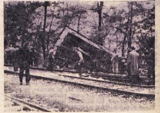
Takole je, kadar zdrkne vagon s tirov...