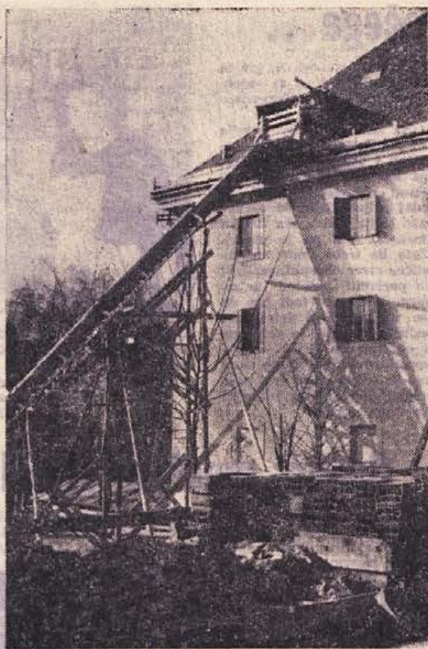
Razglednica iz Dolenjskih Toplic: takšne so te dni, ko so začeli nadzidavati stavbo zdravilišča. Začelo se je delo, da se Dolenjske Toplice spremene v močno revmatološko središče

Na nedavnem zboru volivcev so Žužemberčani našli več problemov, ki bi jih bilo treba rešiti skladno z družbenim planom občine. Tako so povedali, da je treba na vsak način najti sredstva za dograditev žužemberškega vodovoda, ureditev gradu v Žužemberku in za odstranitev ruševin.