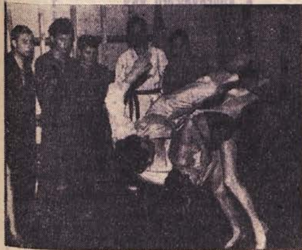
Učenec preizkuša svoje znanje na učitelju.

Upamo, da bo imel takrat ta šport še več pristašev, prizadevnim judoistom pa želimo čim hitrejšo napredovanje. M. P.