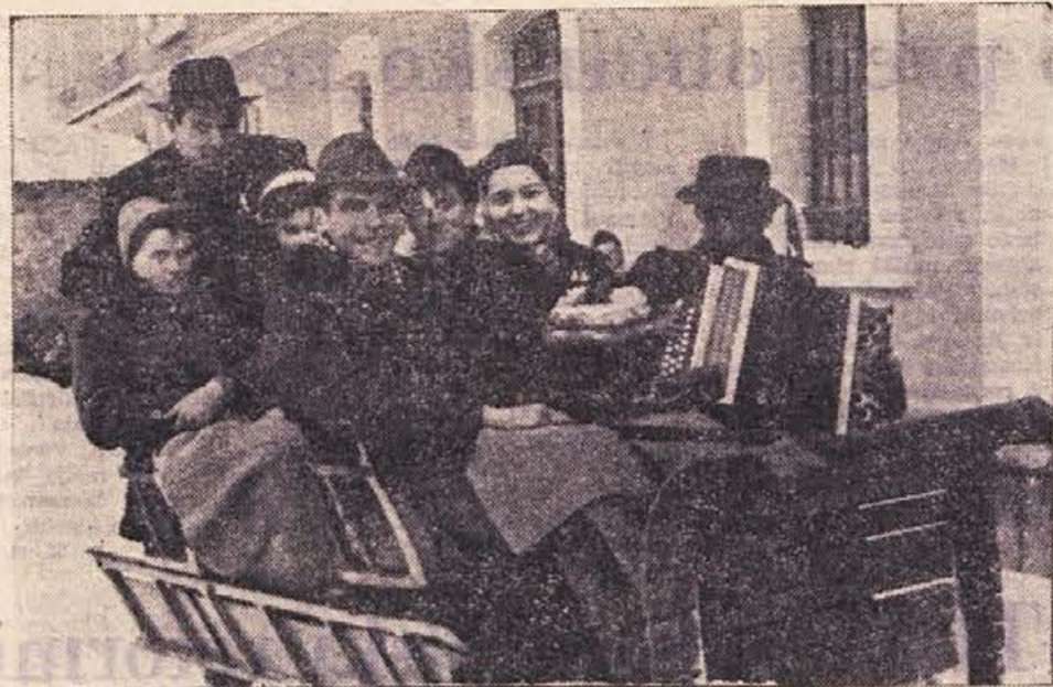
Svatovanje je najlepši dan v družini na Dolenskem. Dolga in ostra zima je spravila izpod pristrteškov vse sani in ko pridejo vse priče in godce, se začne vesela pot...