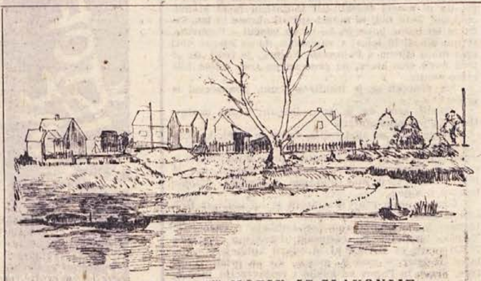
Zdenka Golob-Borčič: MOTIV IZ SLAVONIJE