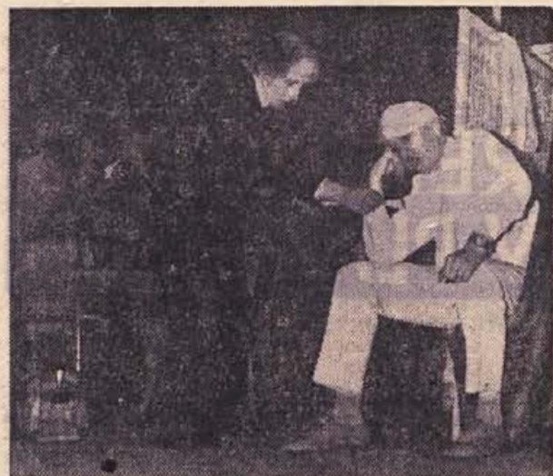
KUD »Ivan Cankar« iz Leskovca pri Krškem je uprizoril v soboto in nedeljo komedijo Draga Gervaisa Zaradi stanovanja.