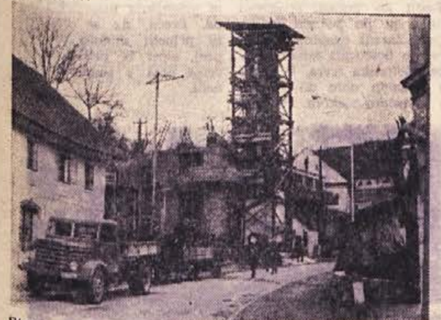
Stolp gasilskega doma? — Ne, na sliki vidimo samo leseno konstrukcijo ob zidovju nastajajočega hotela v Metliki. Zadnje dni so z gradnjo pohiteli, ker je marčevo, še bolj pa aprilsko vreme velik sovražnik gradbenikov. Pohiteti pa je treba tudi zato, ker bo, kakor pravijo, šele ta hotel poživil metliško gostinstvo in turizem